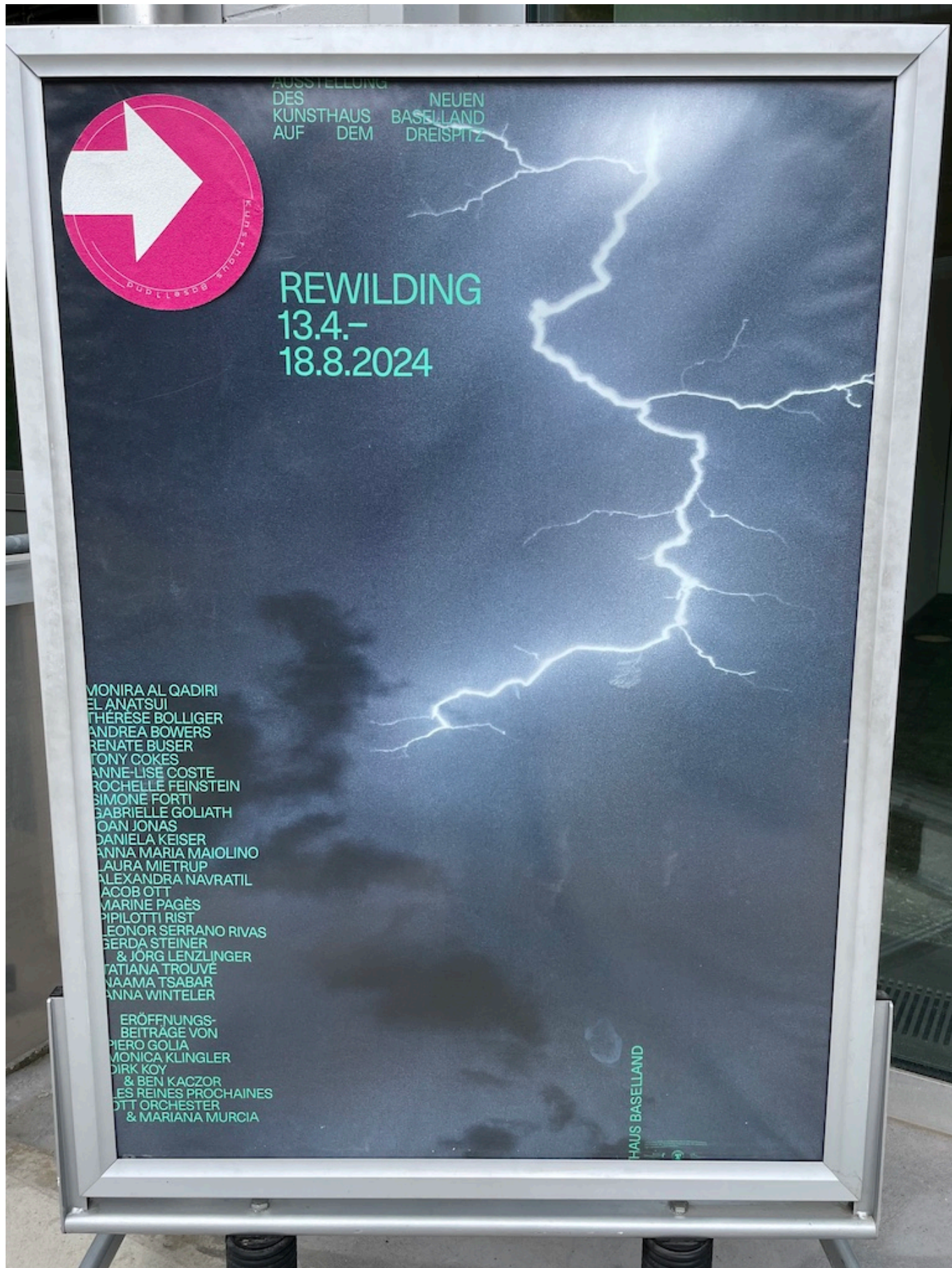
Так выглядит афиша выставки

Подобное разнообразие публики – нечастое в базельских художественных музеях –