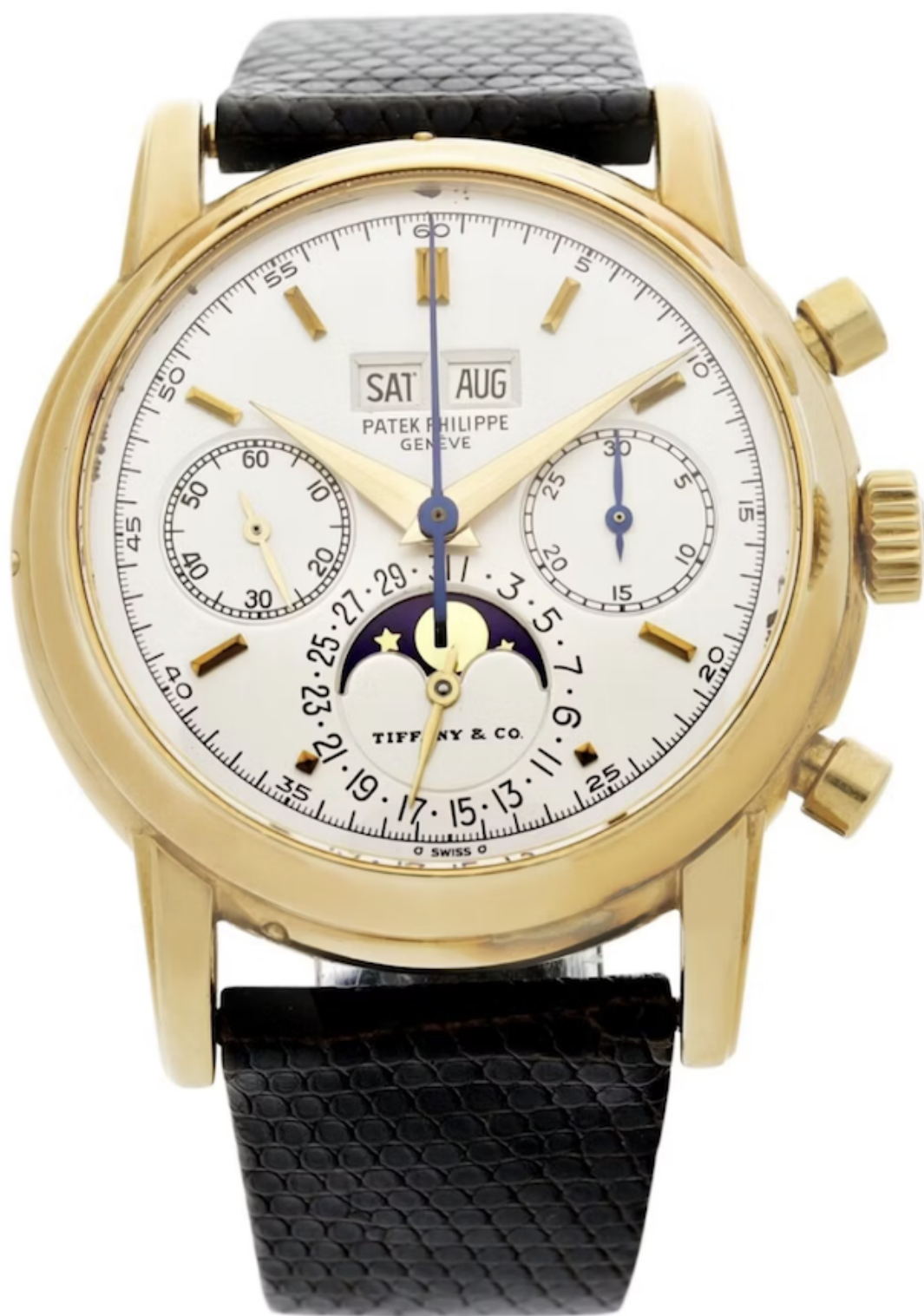
Patek Philippe 2499 – такая же модель, как у Джона Леннона.