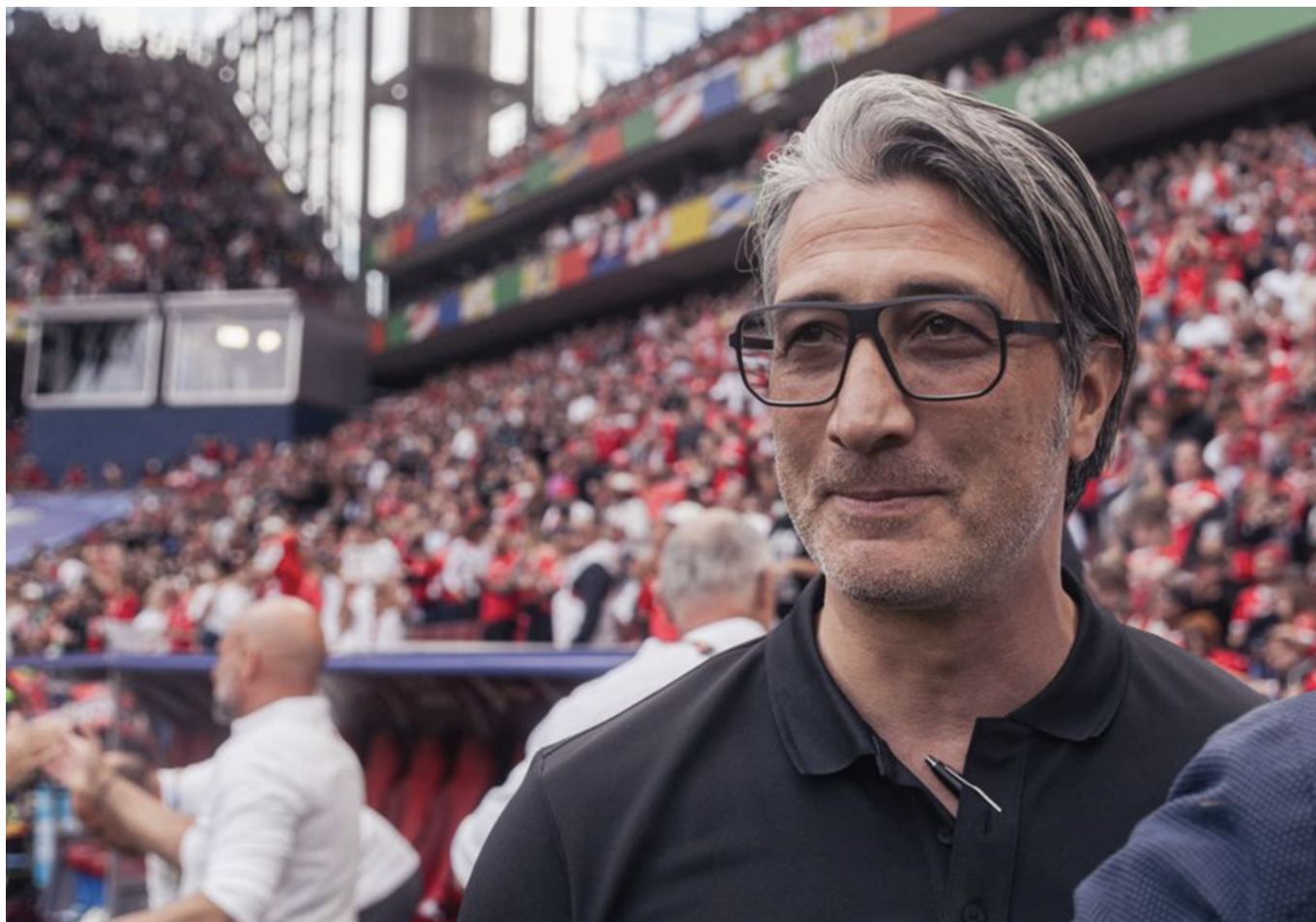
Фото: Instagram-аккаунт Götti Switzerland

Auteur: Зарина Салимова, Цюрих , 28.06.2024.