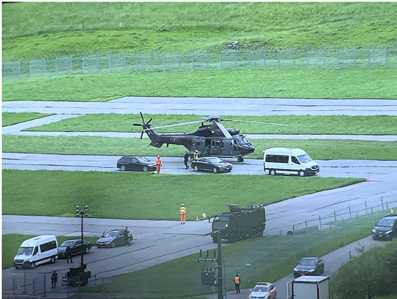
Вертолет не роскошь, а средство передвижения