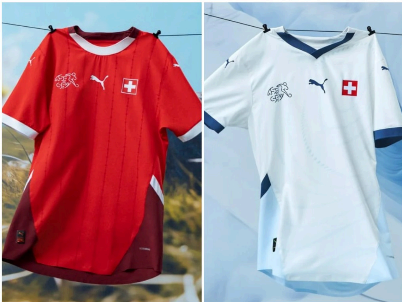
Домашняя и гостевая футболки

Что касается Чемпионата Европы по футболу, который пройдет в Германии с 14 июня по 14 июля, то швейцарцы выйдут на поле в форме Puma. Белые футболки были вдохновлены вершиной Юнгфрауих, где находится самая высокая железнодорожная станция в Европе. Синие акценты (V-образный вырез и кант на рукавах), видимо, должны напоминать о снеге, горах и льде, а узорчатые линии, по задумке дизайнеров, отсылают к шпалам железной дороги «Юнгфрау». Домашние же футболки имеют красный цвет, белую горловину и белый кант на рукавах. Вертикальные полосы с графичным изображением эдельвейса вдохновлены традиционным швейцарским костюмом.