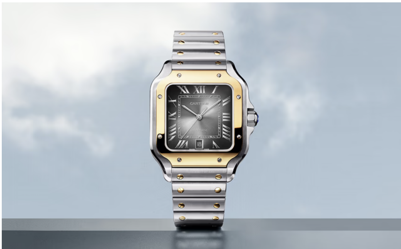
Современная модель Santos de Cartier © Cartier

В 1940-50-х годах квадратные экземпляры были и в каталоге Rolex. Квадратные модели также выпускались такими домами, как Audemars Piguet и Vacheron Constantin, например, часы 50-х годов Vacheron Constantin «Cioccolato» получили свое «шоколадное» прозвище, потому что они были похожи на кусочки популярного в Италии того времени шоколада.