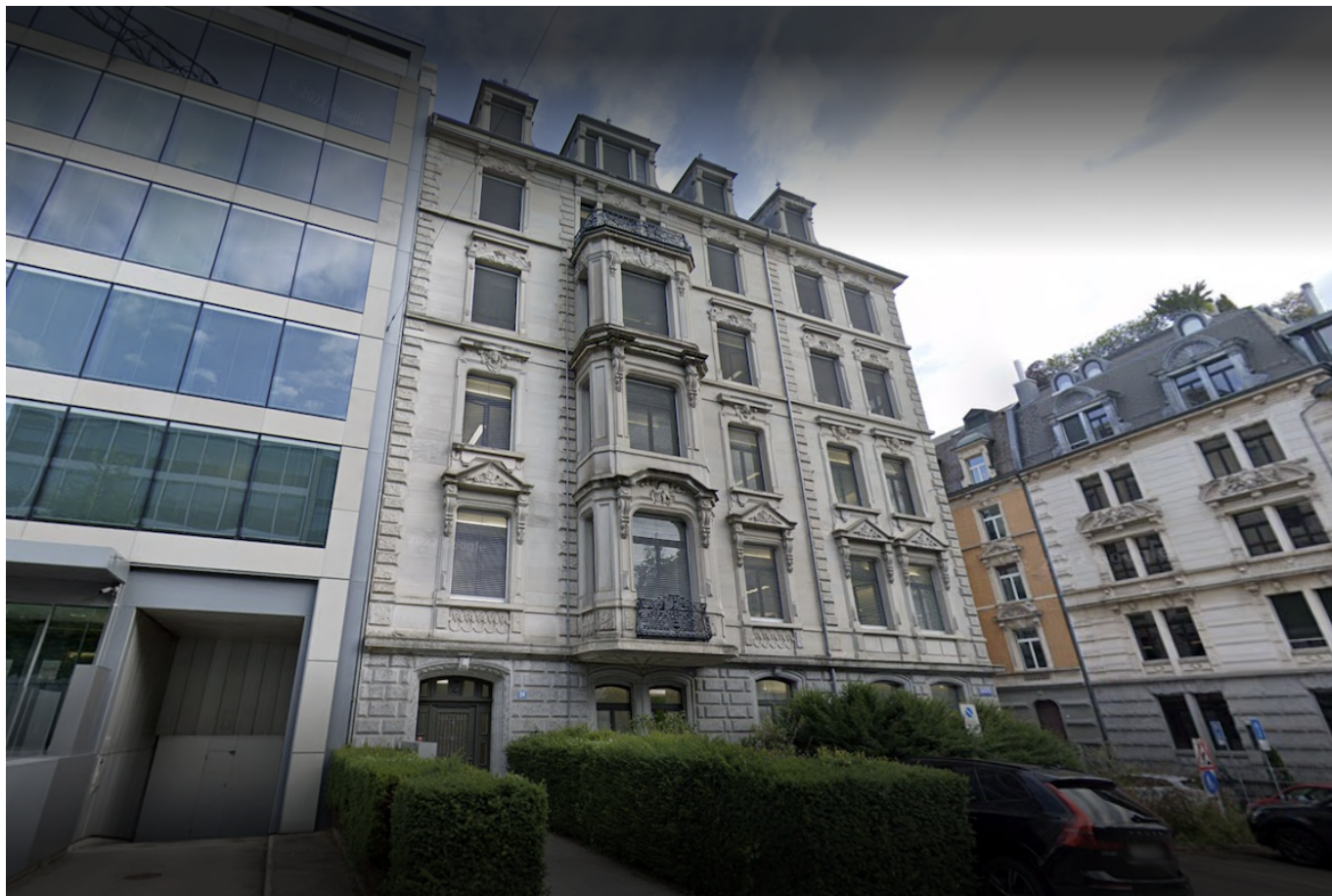
Цюрихский офис TradeXbank.

Auteur: Заррина Салимова, Женева-Цюрих , 22.05.2024.