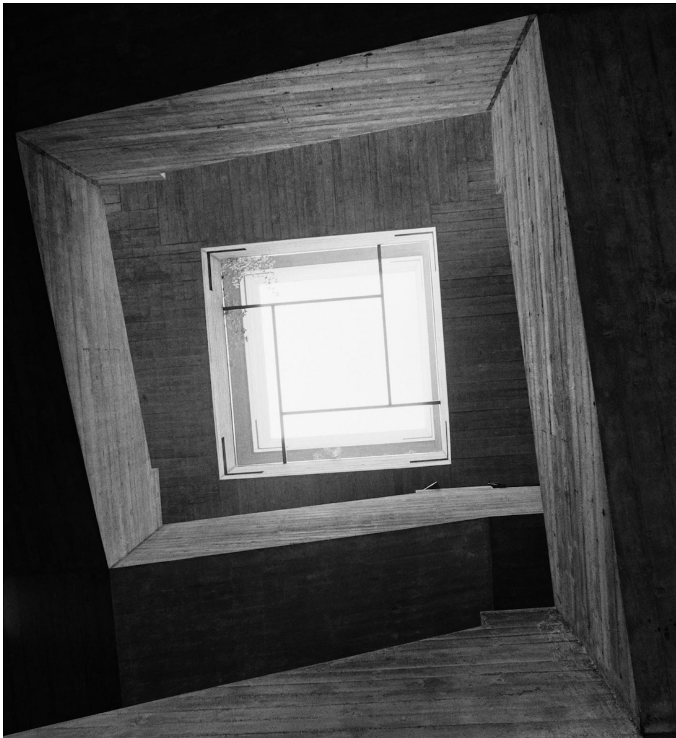
Люсьен Эрве, Университет Санкт-Галлена (архитектор: Вальтер М. Фёрдерер), 1964 © Lucien Hervé