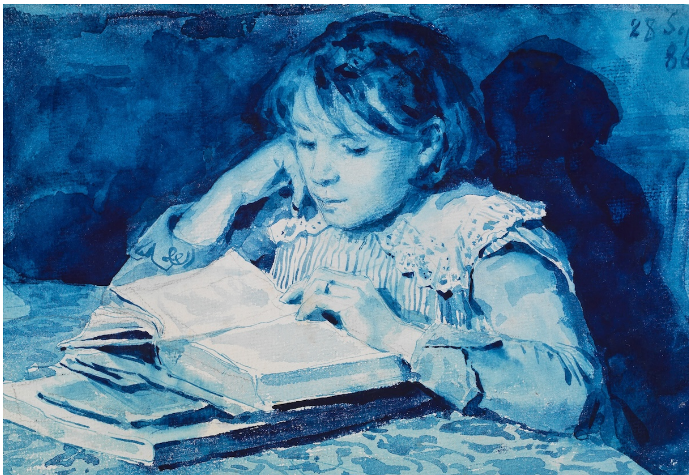
Альберт Анкер. Сесиль Анкер, 28 сентября 1886 года © Kunstmuseum Bern

Auteur: Зарина Салимова, Берн , 17.05.2024.