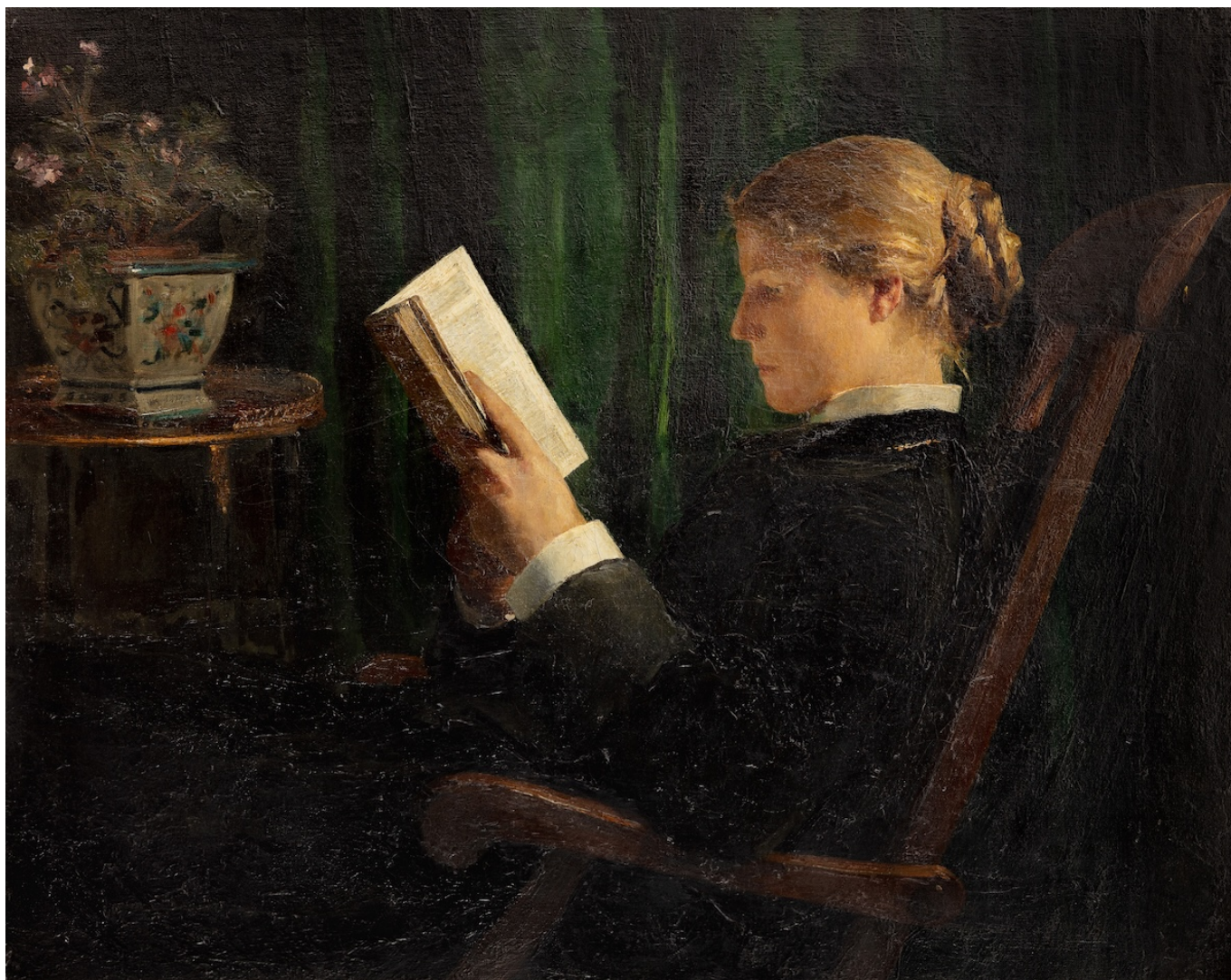
Альберт Анкер. Читающая девушка, 1883