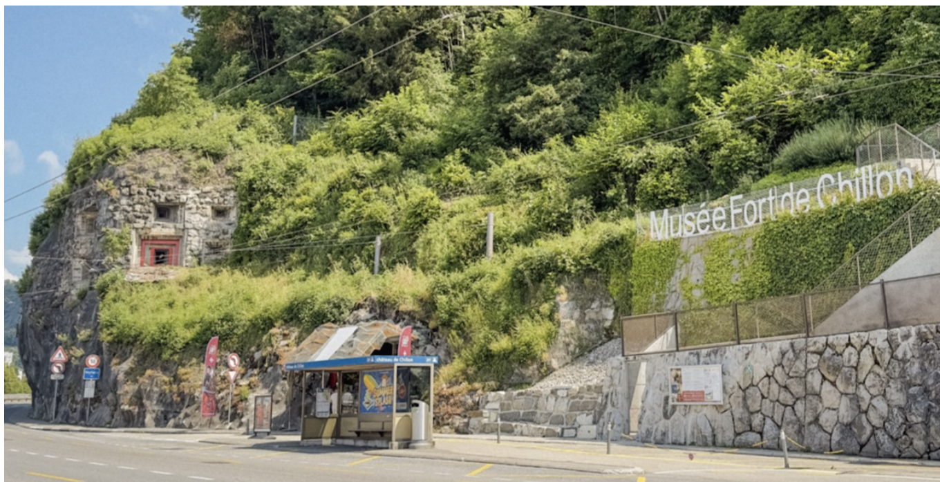
Фото: Fort de Chillon