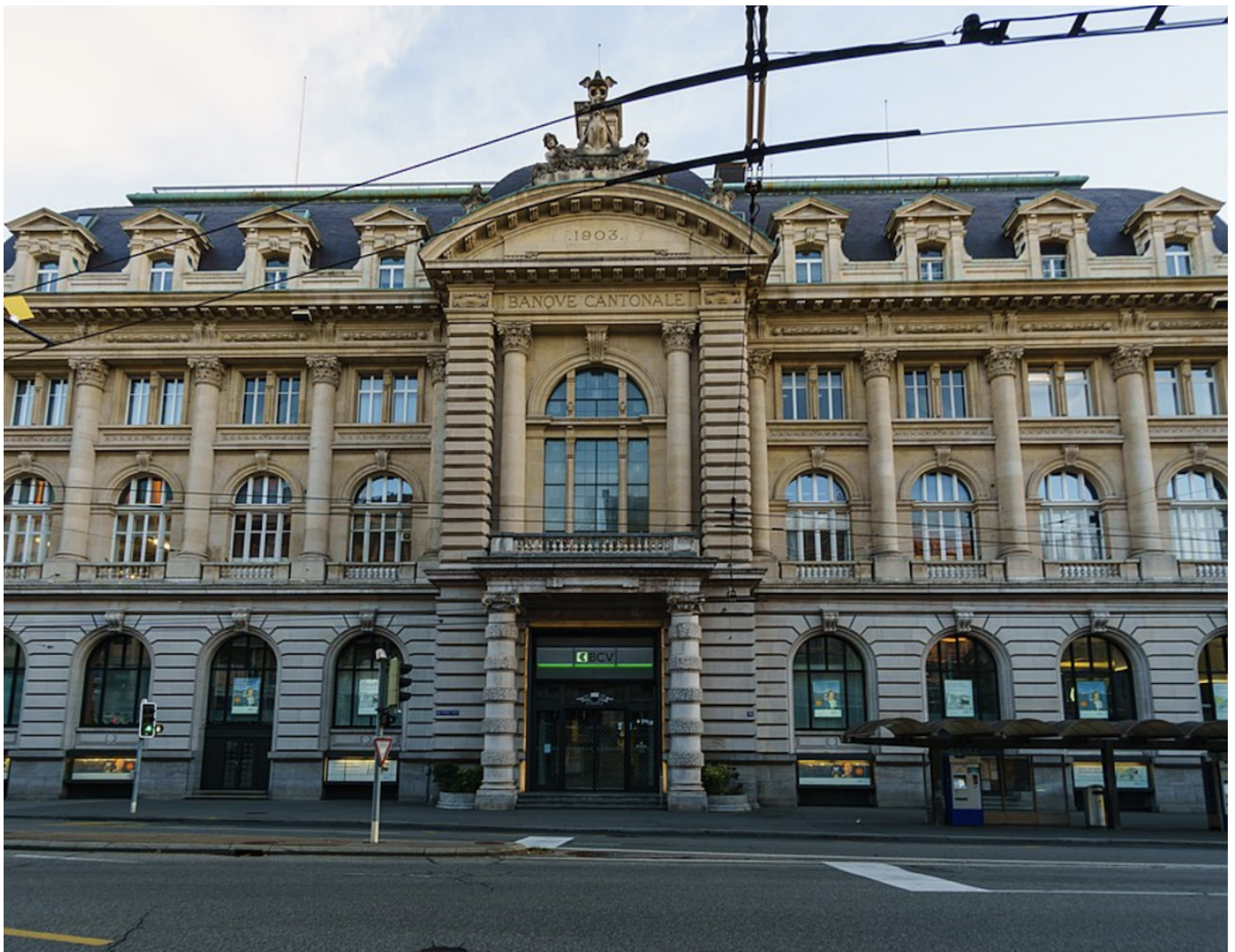
Здание Водуазского кантонального банка в Лозанне. Фото: Hendrik Heiser, Wikimedia Commons

Auteur: Заррина Салимова, Лозанна , 16.04.2024.