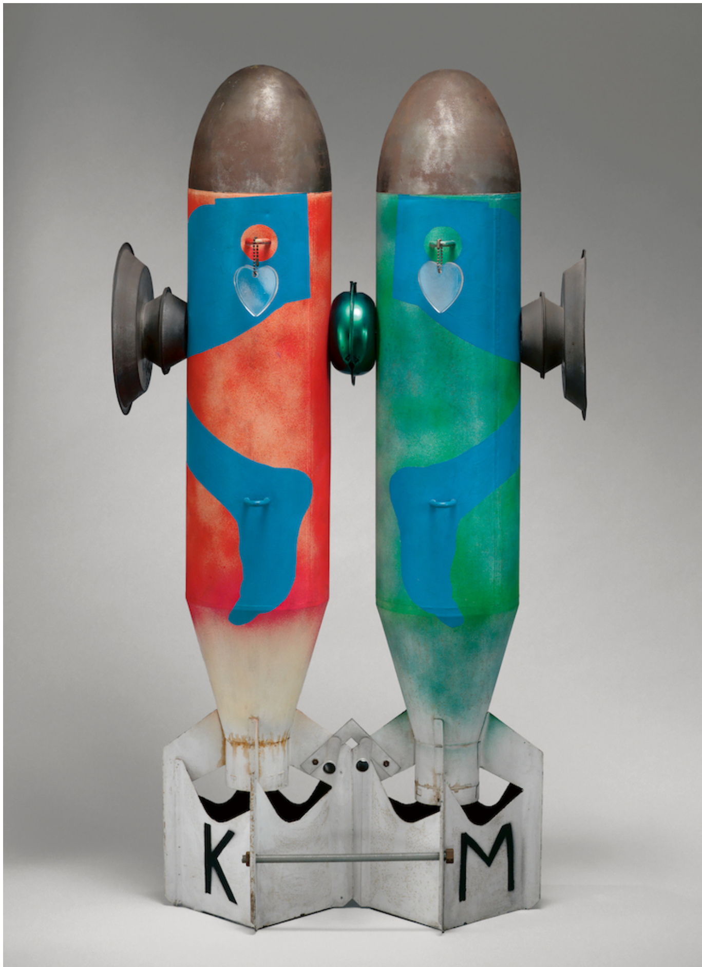
Кики Когельник. Влюбленные бомбы, 1964 г. Kiki Kogelnik Foundation © Kiki Kogelnik Foundation. All rights reserved