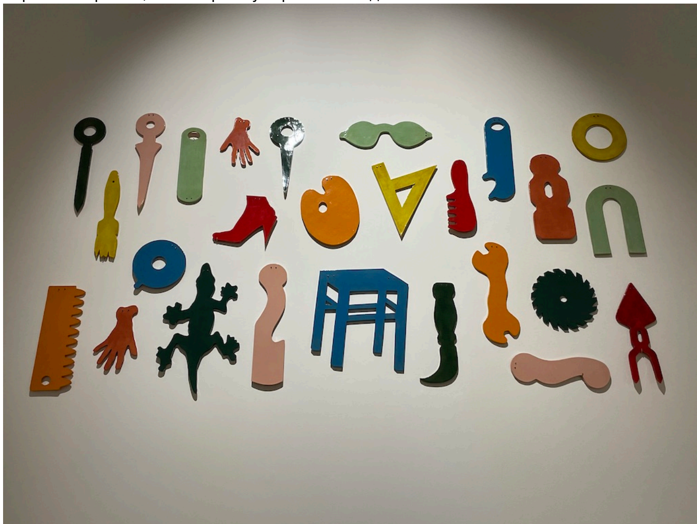
Кики Когельник. Алфавит, © Kiki Kogelnik Foundation. All rights reserved

одаренной, но все-таки подверженной влиянию коллег художницы до самостоятельной и самодостаточной творческой личности со своим самобытным и узнаваемым стилем. Особое внимание уделяется тому, как менялось ее отношение к собственной внешности и женской идентичности: от первых немного «зажатых» изображений до танцующих, свободных и раскрепощенных. Завершает выставку один из последних автопортретов художницы – коротко остриженной, с печальным, напряженным лицом, до неузнаваемости изменившейся в ходе болезни: по печальной иронии судьбы Кики была замужем за онкологом-радиологом и при этом многие годы боролась с раком, от которого умерла в 62 года.