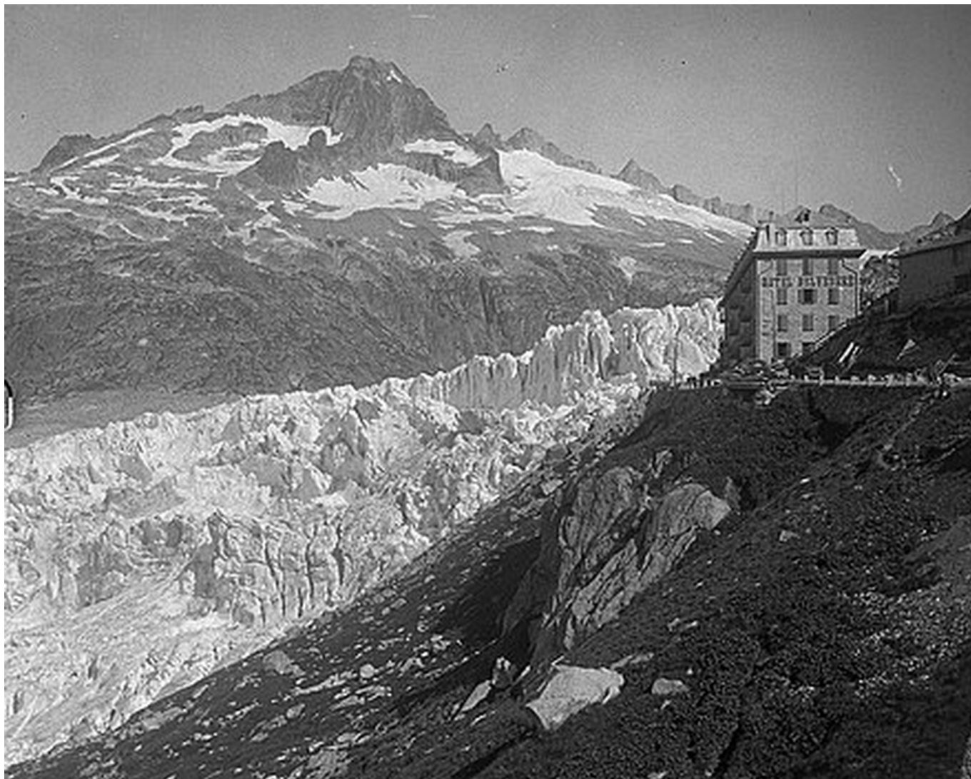
Отель Belvédère. Фотография 1905 года

Дела отеля шли весьма неплохо вплоть до конца 1960-х годов: здесь даже «отметился» Джеймс Бонд. Тот, кто смотрел фильм 1964 года «Голдфингер», возможно, вспомнит сцену, когда агент 007 преодолевает перевал на своем знаменитом автомобиле Aston Martin и проезжает мимо Belvédère. Однако постепенно число посетителей гостиницы стало уменьшаться. Частично это объясняется тем, что автомобили стали более мощными: теперь можно было гораздо быстрее подняться на перевал, полюбоваться на ледник и спуститься засветло обратно, не останавливаясь на ночь в отеле. Еще один удар по гостинице нанесло строительство железнодорожного тоннеля, который, как ранее узкоколейная железная дорога, соединил кантоны Ури и Вале. По новой железной дороге через туннель стало возможным перевозить автомобили на специальных платформах, что позволило туристам не подниматься на перевал Фурка.