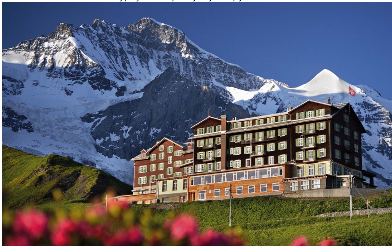
Отель Bellevue des Alpes

Постояльцами отеля становились не только любители красивых видов. Отсюда отправлялись и по-прежнему отправляются штурмовать самый сложный северный склон горы Эйгер. Пишут, что не было ни одного знаменитого альпиниста, поднимавшегося на Эйгер, кто не провел бы ночь в этой гостинице. А те, кто не любит риск, может занять место на террасе отеля и оттуда наблюдать за тем, как отважные альпинисты штурмуют неприступную гору.