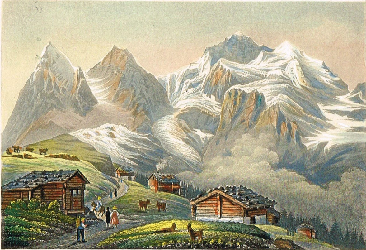
Wengernalp vers la Jungfrau, Mönch et Eiger.

В одной из этих хижин, возможно, и перекусил Карамзин. Венгернальп. Гравюра XIX века, раскрашенная акварелью. Из коллекции автора.