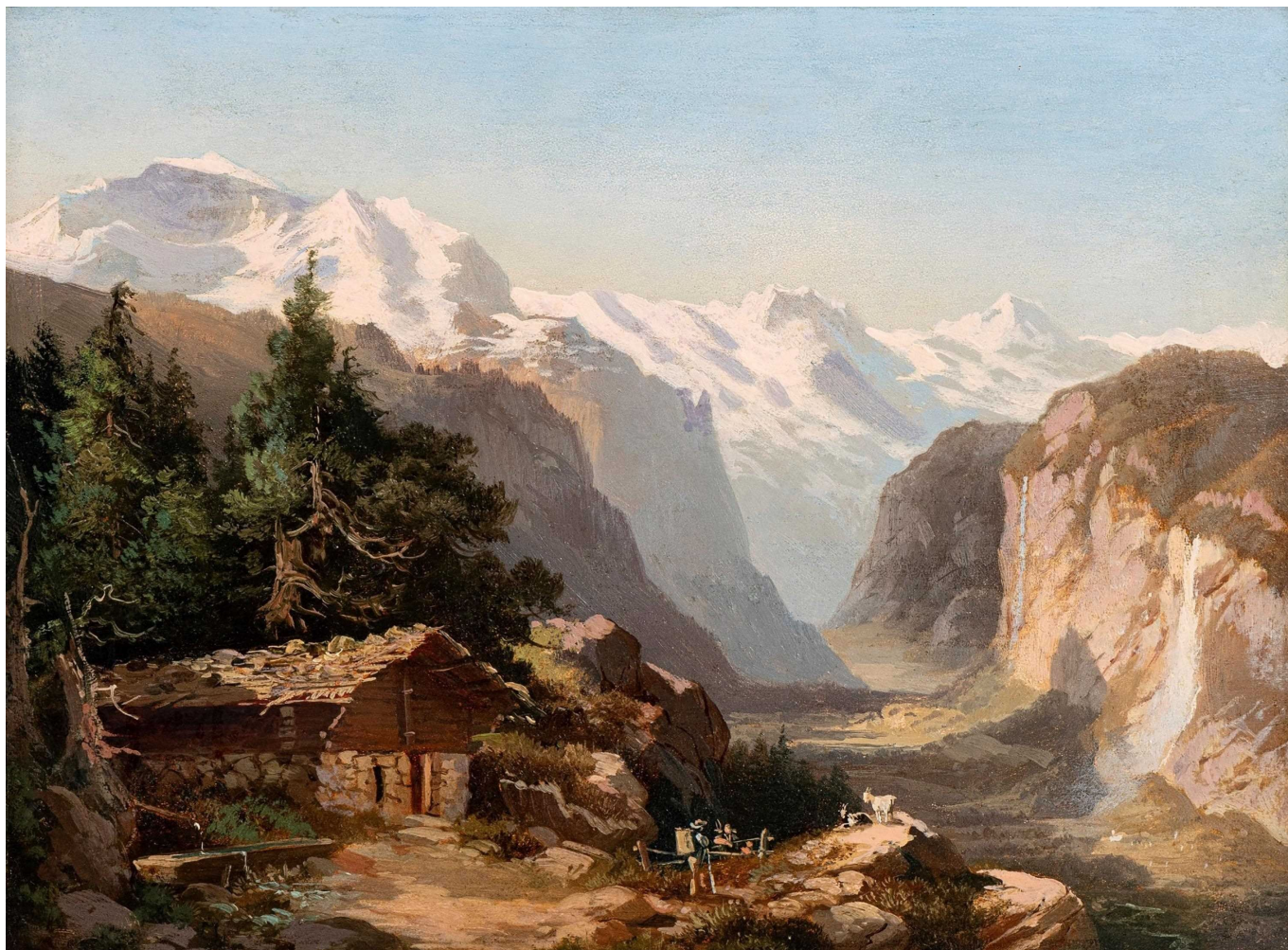
Франсуа Диде. Долина Лаутербруннен. Частное собрание.

Auteur: Наталья Беглова, Интерлакен , 26.07.2024.