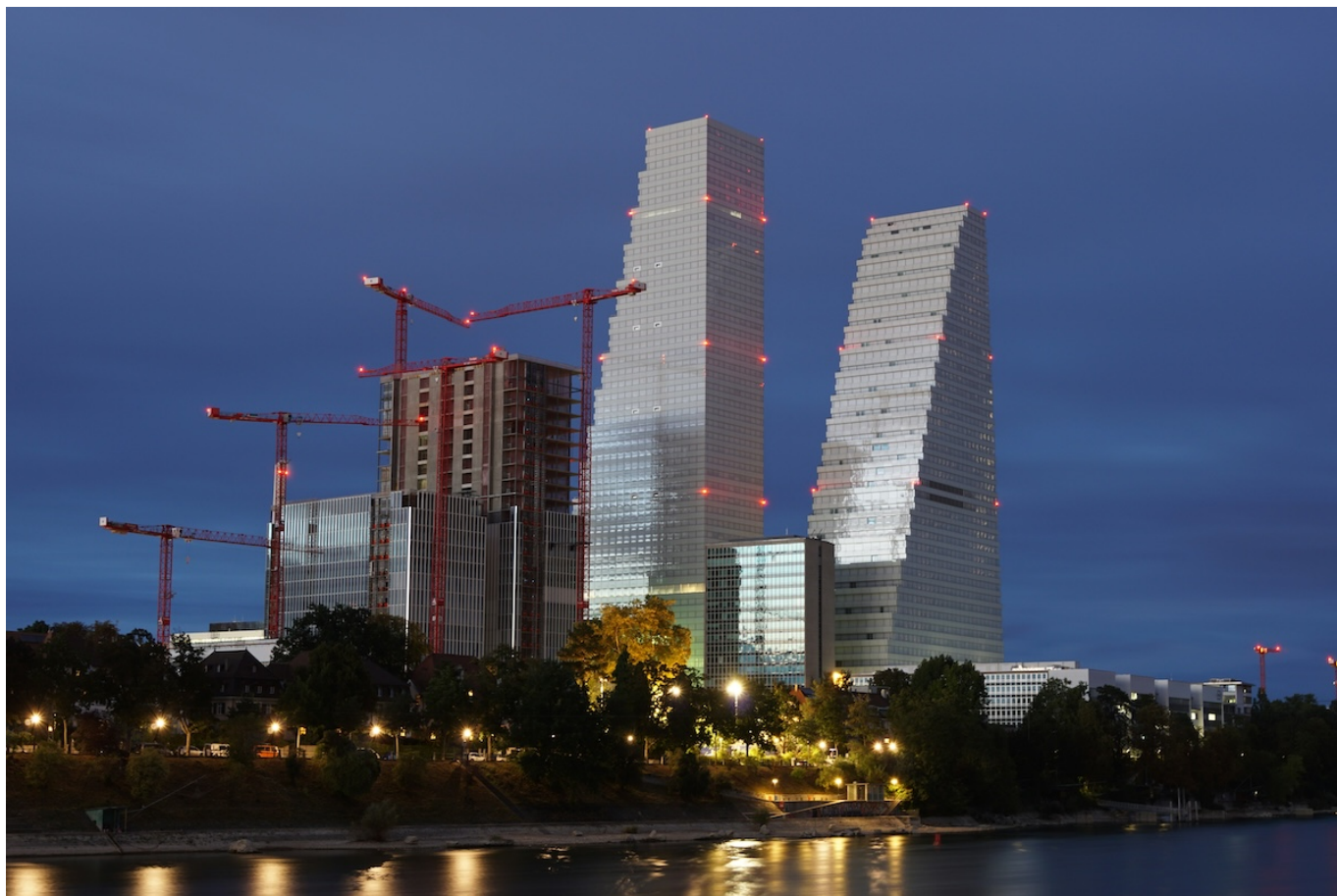
Башни Roche в Базеле.

Auteur: Заррина Салимова, Базель , 20.02.2024.