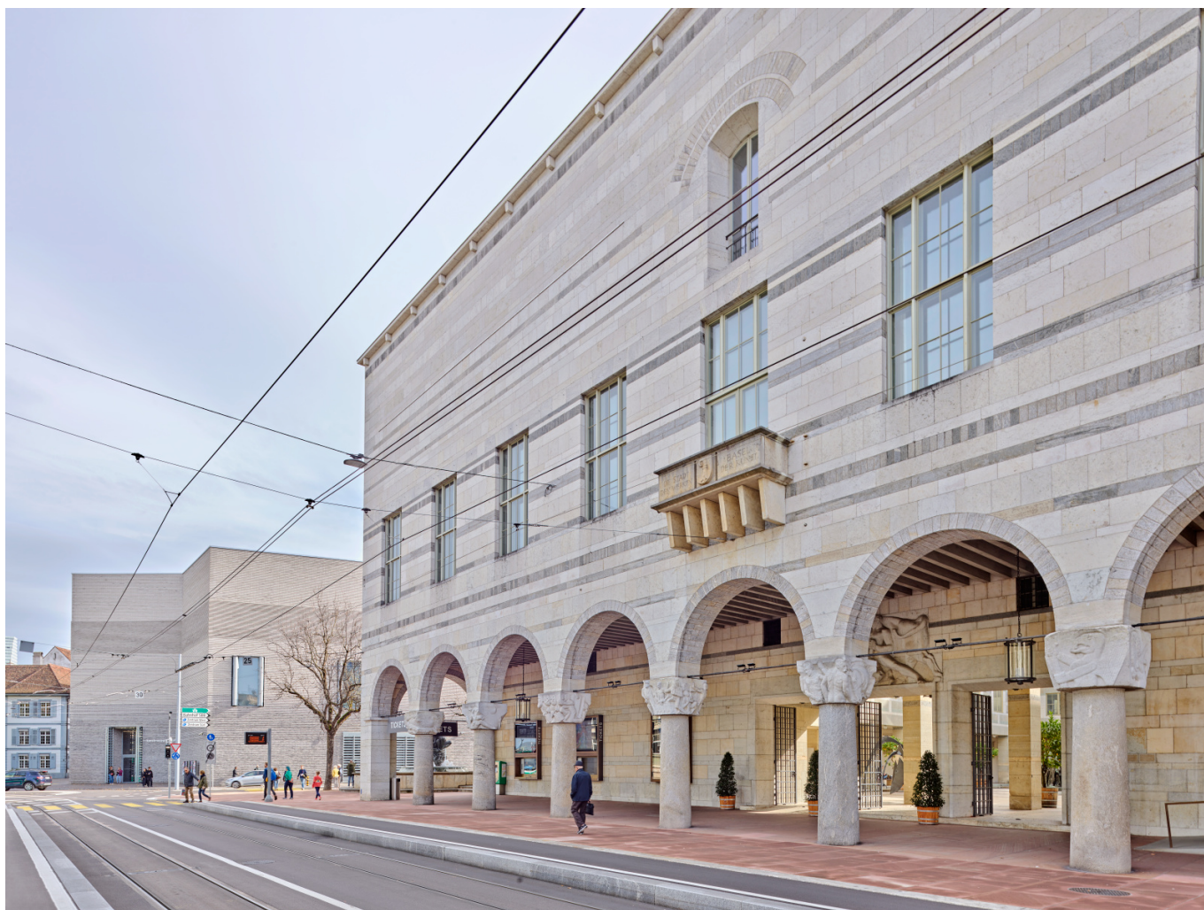
Художественный музей Базеля

Auteur: Надежда Сикорская, Базель , 09.02.2024.