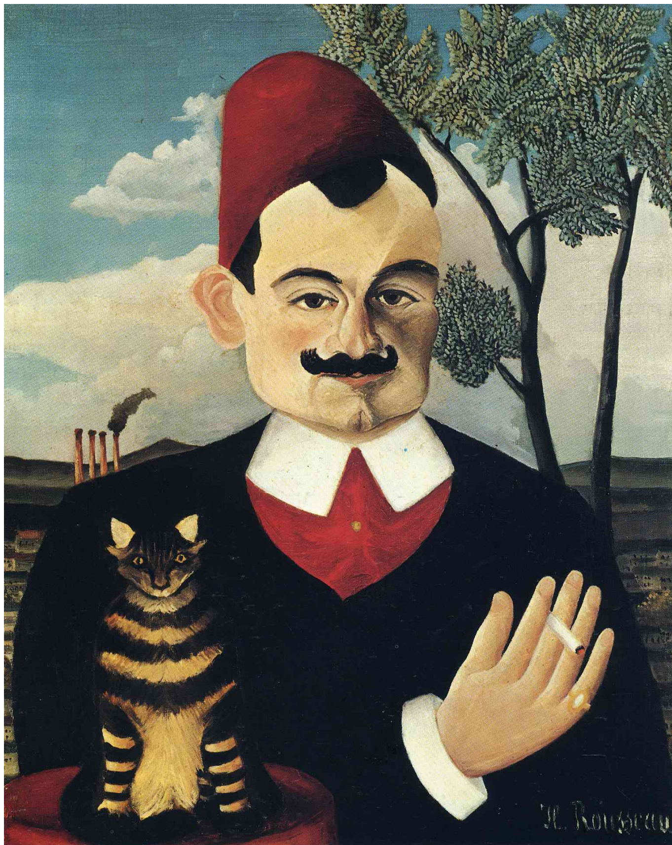
Анри Руссо. "Портрет Пьера Лоти", с 1941 года хранящийся в Кунстхаусе Цюриха

Что дальше? В соответствии с «Вашингтонскими принципами» 1998 года, которые подписала и Швейцария, должно быть найдено «справедливое решение», то есть определена некая денежная сумма, размер которой не будет разглашаться. «В отличие от конфискованного искусства, art en fite относится к произведениям, которые владелец смог продать в безопасной стране, например, в Швейцарии, из-за