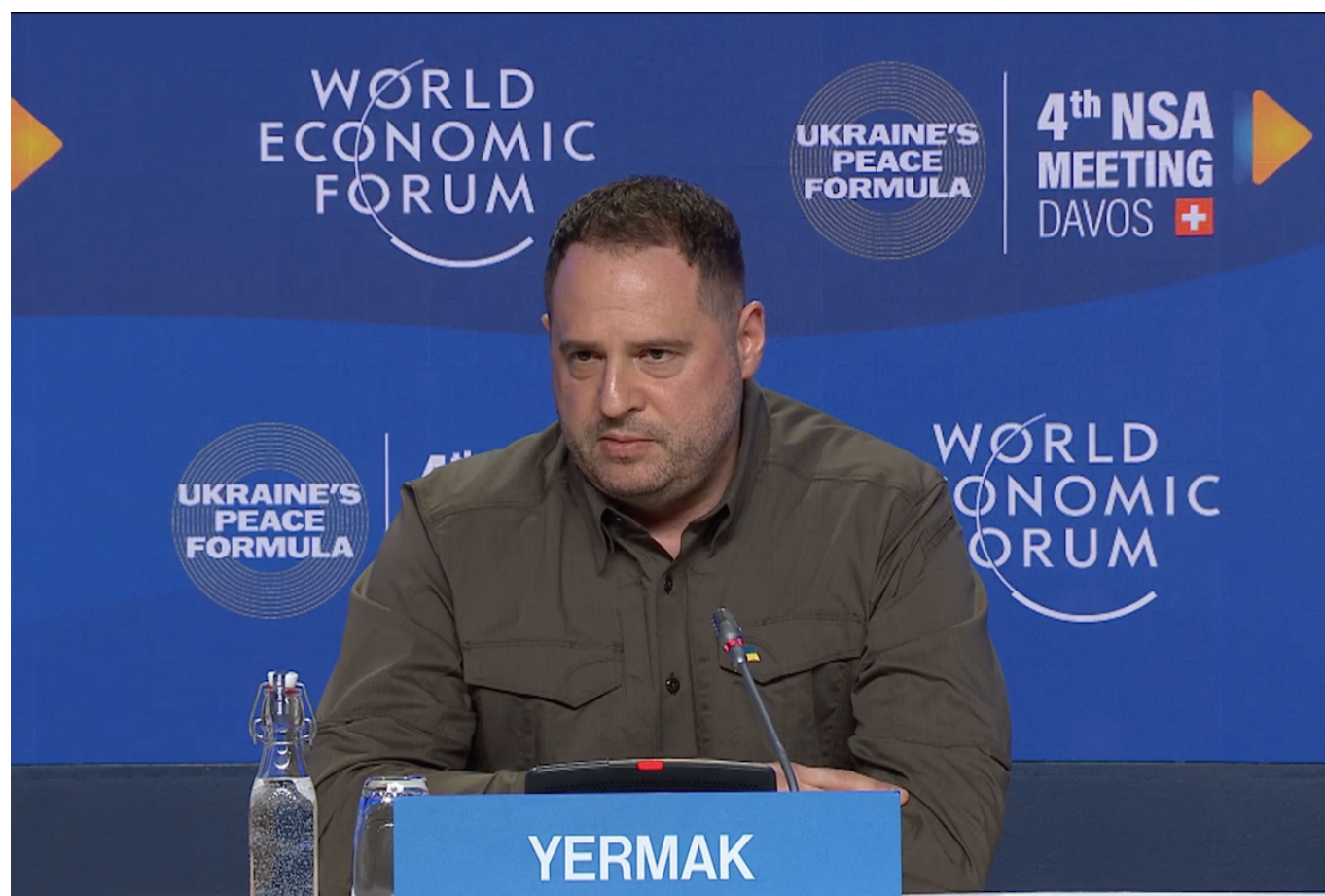
Глава администрации президента Украины Андрей Ермак на пресс-конференции, посвященной итогам встречи по украинской «формуле мира».

независимость, территориальная целостность и суверенитет Украины. Делегации также едины в отношении основных принципов, на которых базируется международное право и устав ООН. При этом Андрей Ермак признал, что, несмотря на широкий консенсус, было бы неправильно говорить, что все придерживаются одинаковых позиций – разногласия касаются того, как привлечь Россию за стол переговоров. В свою очередь министр обороны Украины Рустем Умеров, отвечая на вопрос представителей СМИ об обороноспособности Украины, отметил, что «мы никогда не сдадимся».