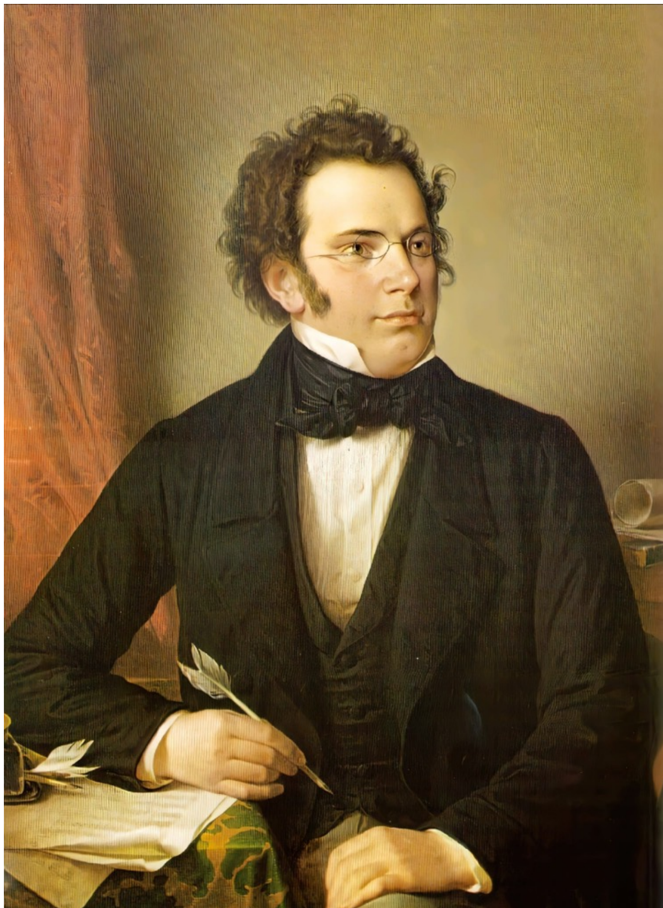
Франц Шуберт (1797-1828)