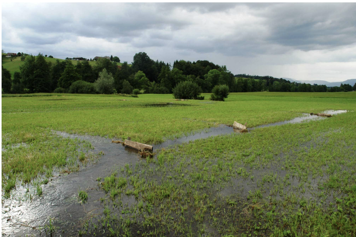
Луг в Альтбюроне

В Швейцарии подобные системы используются в Вале (о знаменитых валезанских каналах «бисс» мы уже не раз рассказывали), а также на орошаемых лугах в долинах рек Лангетен, Оенц и Рот. Любопытно, что в кантонах Берн и Люцерн использованию этих ирригационных систем способствовали монахи-цистерцианцы монастыря Святого Урбана. Еще в XIII веке они создали разветвленные сети каналов, которые были оборудованы шлюзами, водоспусками, плотинами, а также плотинными щитами. Луга поливали несколько раз в год, а переносимые водой взвешенные вещества служили удобрением.