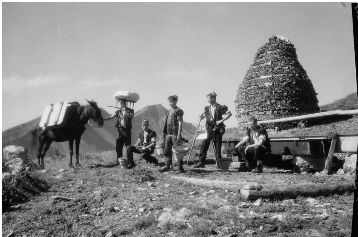
Пастухи позируют со всей своей утварью перед шале и дровяным складом, около

Идиллические альпийские луга с невозмутимо пасущимися на них коровами стали одним из символов Швейцарии. На протяжении столетий художники и писатели прославляли горные пастбища и шале как воплощение простого, искреннего, «чистого», неиспорченного и близкого к природе образа жизни. В целом, не будет преувеличением сказать, что альпийский сезон пастбищ – это маркер швейцарской идентичности.