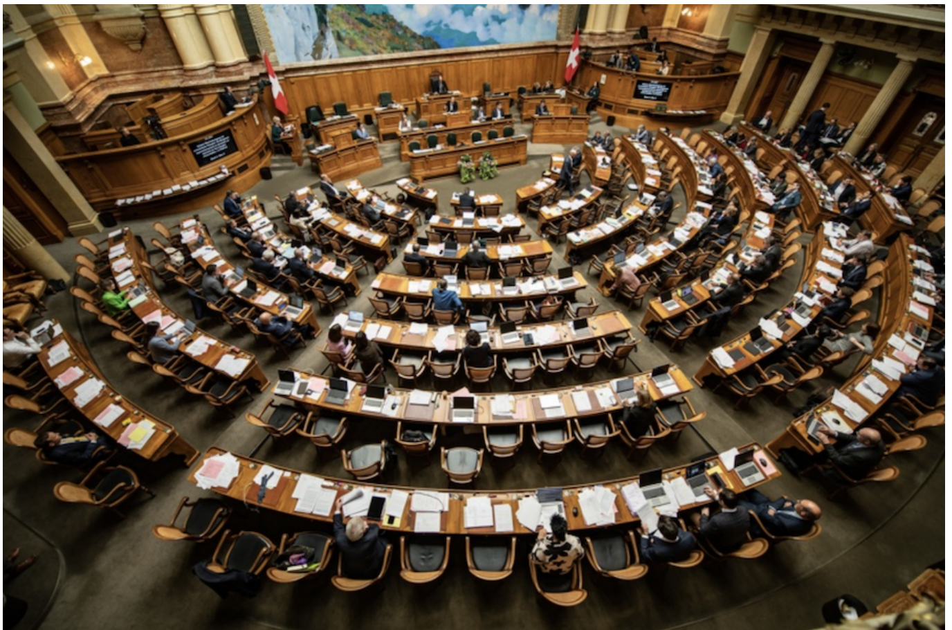
Зал заседаний Национального совета

Auteur: Заррина Салимова, Берн , 20.12.2023.