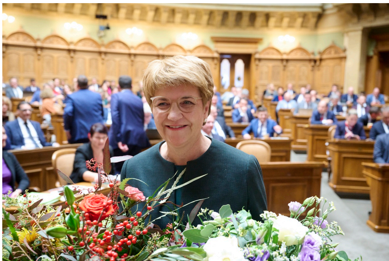
Виола Амхерд.

Пост президента Швейцарии в следующем году займет Виола Амхерд – и это ни для кого не стало неожиданностью. Если в недемократических странах имя президента известно задолго до окончания выборов из-за отсутствия сменяемости власти, то в Конфедерации это происходит совсем по другим причинам. Швейцарский президент избирается сроком на один год среди семи членов Федерального совета, при этом им становится тот, кто в предыдущем году занимал пост вице-президента. Как правило, интрига заключается только в том, сколько голосов получит на выборах новый президент. Виола Амхерд была избрана 158 голосами из 204 действительных бюллетеней. Вице-президентом станет министр финансов Карин Келлер-Суттер, которая, следовательно, в 2025 году будет президентом.