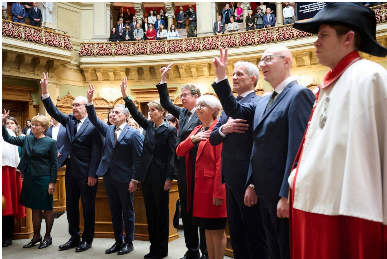
Присяга федеральных советников и канцлера.