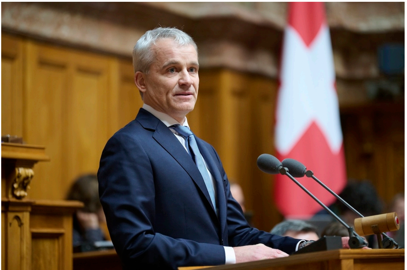
Беат Янс.