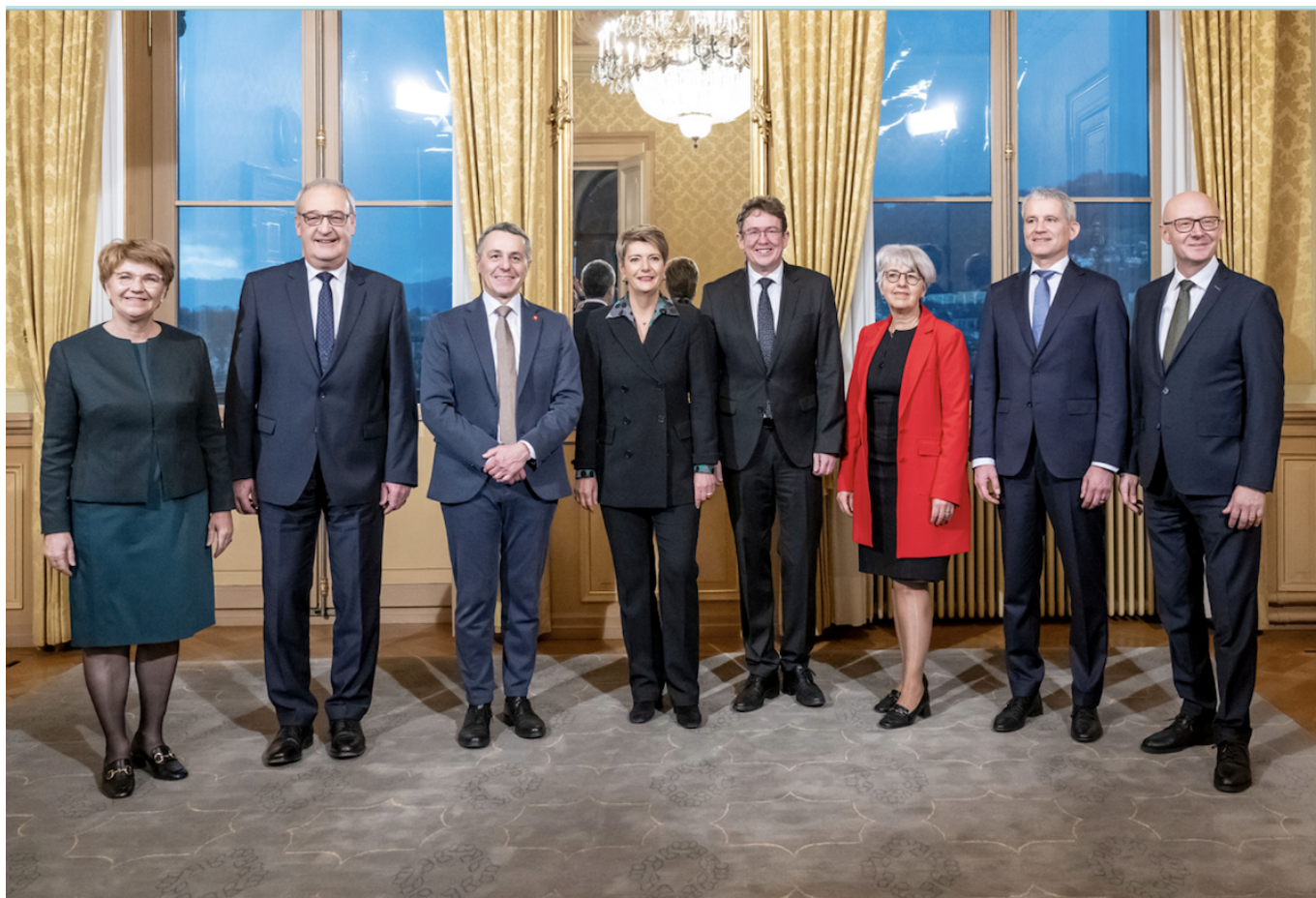
Новый состав Федерального совета.

Auteur: Заррина Салимова, Берн , 14.12.2023.