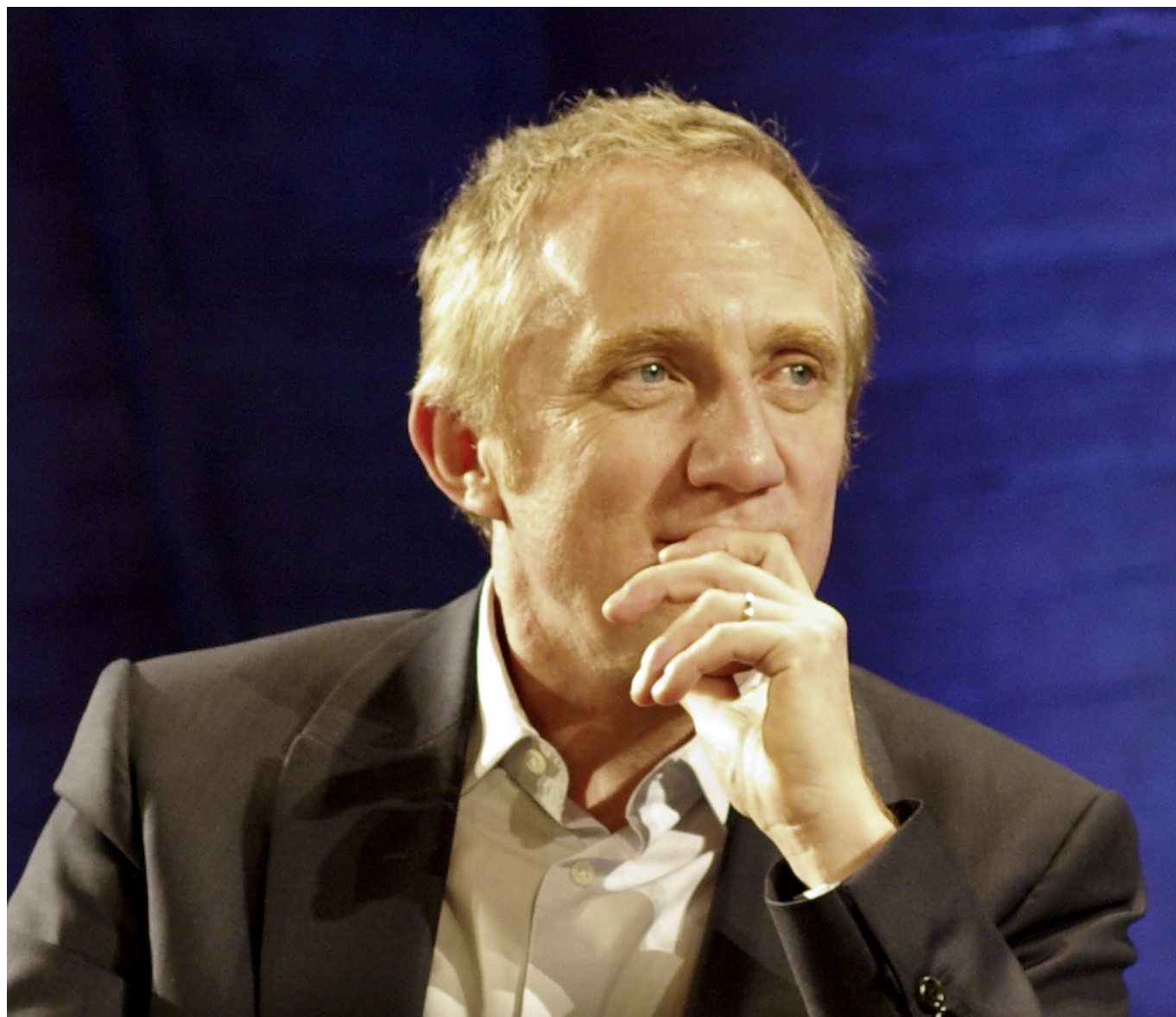
Франсуа-Анри Пино в 2011 году.

Однако в этом году аукцион Only Watch не состоялся. Как уже рассказывала Наша Газета, мероприятие было отменено после того, как возникли сомнения в правильности финансовой отчетности фонда-организатора. В настоящее время компания KPMG в Монако проводит аудит, выводы которого ожидаются не раньше весны следующего года. Каким бы ни был результат, по мнению некоторых экспертов, аукцион вряд ли останется таким же, каким был раньше.