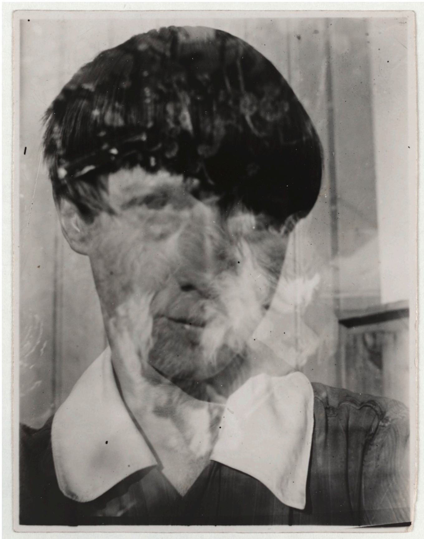
Без названия (Ханна Хёх. Портретная фотография с двойной экспозицией). Berlinische Galerie - Landesmuseum für Moderne Kunst, Fotografie und Architektur

Однозначно ответить на вопрос, кто именно изобрел коллаж, трудно. В этой технике работали кубисты, включая Пабло Пикассо и Жоржа Брака, конструктивисты, например, Александр Родченко, а также дадаисты. Среди берлинских дадаистов