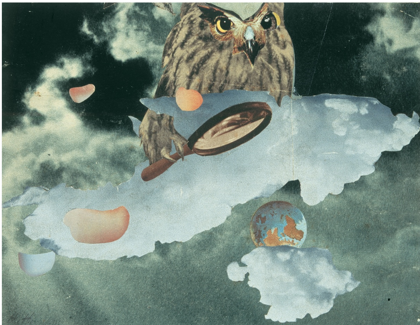
Ханна Хёх. Сова с увеличительным стеклом, 1945 г. Частная коллекция © 2023, ProLitteris, Цюрих

Отдельный зал посвящен «Альбому» - толстой тетради, в которую Ханна Хёх наклеивала интересные ее фотографии, открытки и газетные вырезки. По соображениям сохранности сам «Альбом» представлен в витрине за стеклом, но все страницы оцифрованы и проецируются на одну из стен. Сотни изображений 20-30-х годов вступают в своеобразный диалог друг с другом, а также с теми, кто их разглядывает - это попытка заглянуть в то, что происходило в голове художницы.