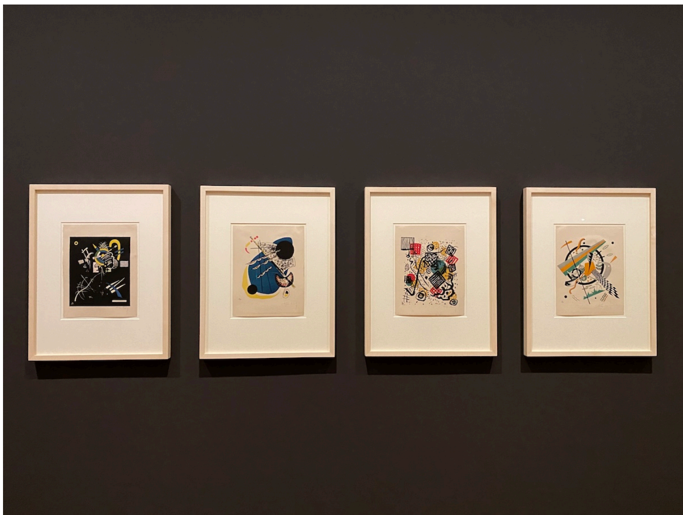
Василий Кандинский. Маленькие миры, 1932.

Ранние фотомонтажи Хёх были полны иронии и отражали актуальные в то время социальные и политические темы, например, взаимоотношения человека и машины, гендерные роли или подъем национал-социализма, например, ее коллажи о «новых женщинах» высмеивали стереотипные представления о красоте. Фотомонтаж был для нее и способом создания абстракции как вида чистого искусства, где главное значение имеют форма, цвет и композиция. На выставке, например, проводятся параллели между творчеством Ханны Хёх и ее современников: заметна композиционная переключка с работами Василия Кандинского и Эля Лисицкого.