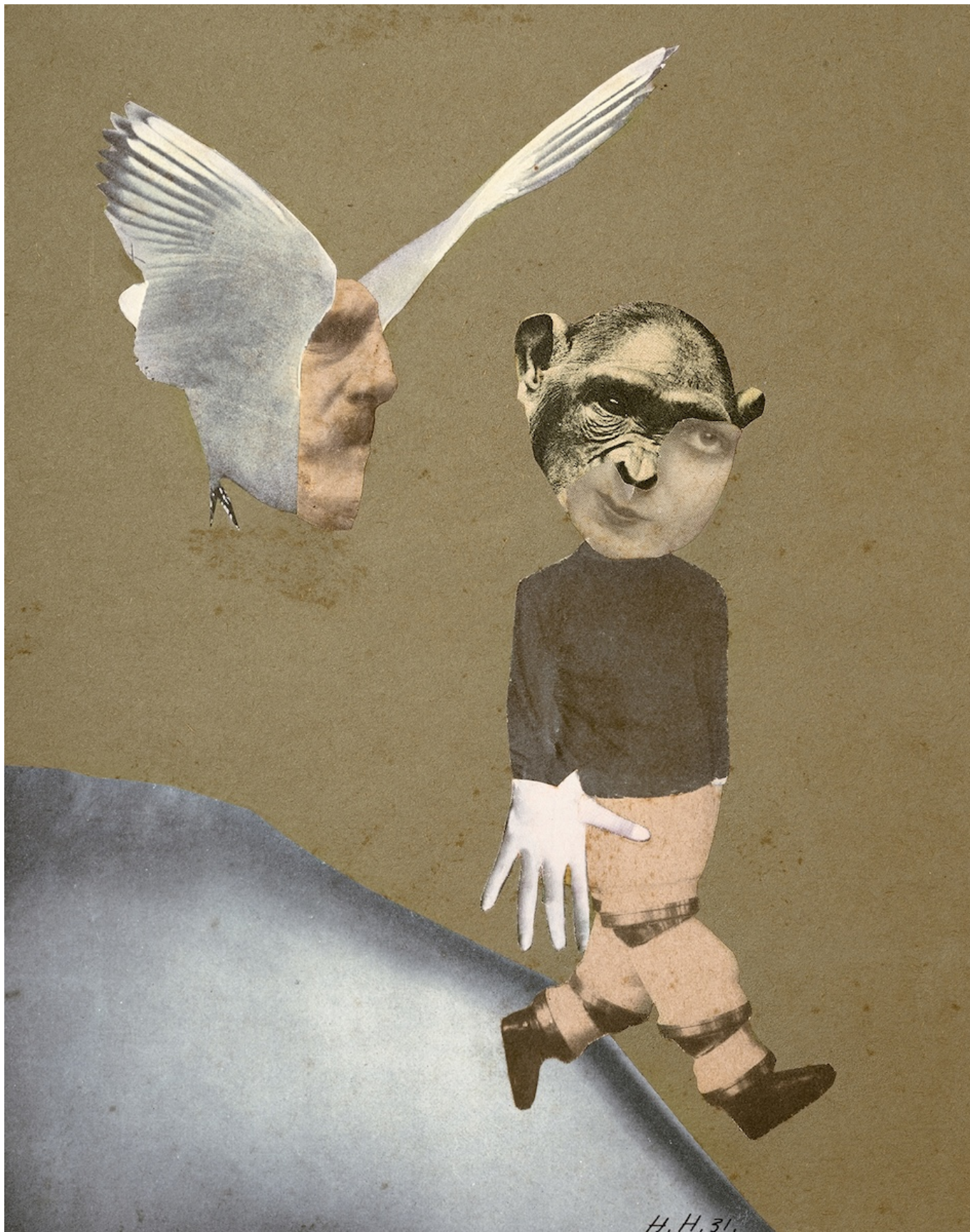
Ханна Хёх. Побег, 1931. Institut für Auslandsbeziehungen e. V., Stuttgart © 2023, ProLitteris, Zurich

Художники послевоенного времени стремились найти новые формы творческого выражения – одной из них и стал коллаж. Произведения буквально «собирались» из фрагментов массовой культуры и назывались «монтажом». При этом художниками двигала идея разложения послевоенного мира на составляющие части и создания из