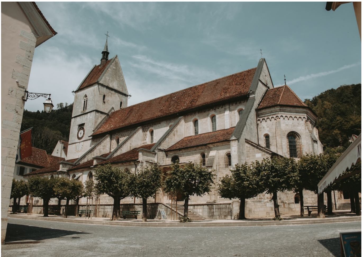
Церковь в Сент-Урсанн.

Сент-Урсанн раскинулся в солнечной долине, между лесистыми холмами и рекой Ду. Согласно легенде, своим возникновением город обязан ирландскому монаху Урсицину, который поселился здесь и жил отшельником в пещере. В его честь была построена часовня, которую, как и саму пещеру, можно посетить и сегодня. За свою многовековую историю городок пережил два крупных пожара и не избежал чумы.