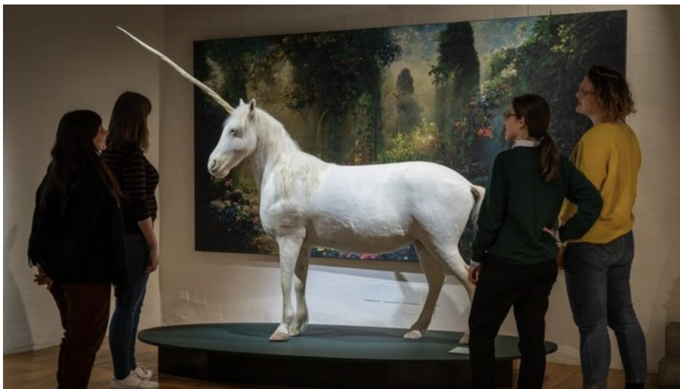
Фото: Schloss Lenzburg

Auteur: Заррина Салимова, Берн , 28.09.2023.