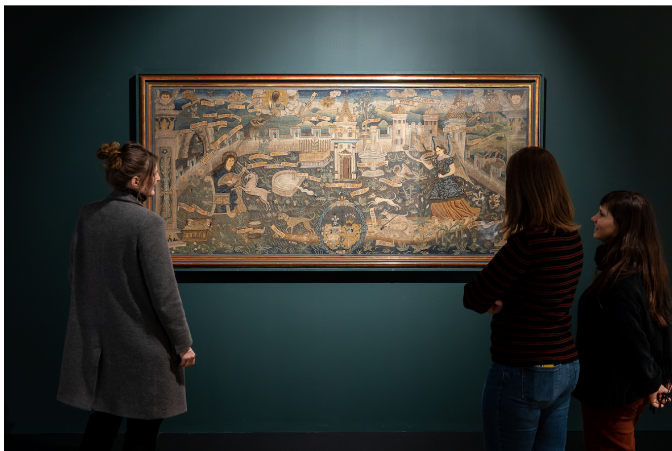
Гобелен с единорогом, 1607 год.

Любопытно, что до начала Возрождения люди верили, что единороги действительно существуют (а некоторые, не сомневаемся, верят и до сих пор!). Так, в Средние века единорог был одним из христианских символических животных и, как и ягненок, олицетворял Иисуса Христа.