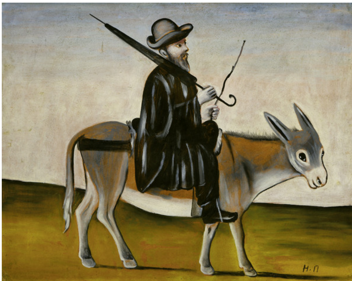
Нико Пиросмани. Лекарь на осле. The Collection of Shalva Amiranashvili Museum of Fine Arts of Georgia, Georgian National Museum, Tbilisi

Так случилось, что об этой выставке мы узнали раньше, чем большинство швейцарских любителей искусства. Будучи летом в Тбилиси, отправились в музей Нико Пиросмани и увидели на фасаде огромную афишу, сообщавшую, что основная коллекция, то есть порядка 50 работ, находилась на тот момент в «Луизиане», датском музее современного искусства, расположенном в Хумлебеке на берегу Эресунна, в 35 км к северу от Копенгагена, а оттуда отправится в «наш» Фонд Бейлера в Базеле. Пришлось набраться терпения, но вчера выставка, наконец, открылась – она организована в сотрудничестве с «Луизианой», а также с Национальным музеем и Министерством культуры, спорта и молодежи Грузии и с фондом Infinitart. Среди тех, кто поддержал прекрасный проект, мы с удовольствием увидели имя Фредерика Паулсена – отрадно, что его меценатская деятельность не прекратилась одновременно со временным закрытием Почетного консульства РФ в Лозанне.