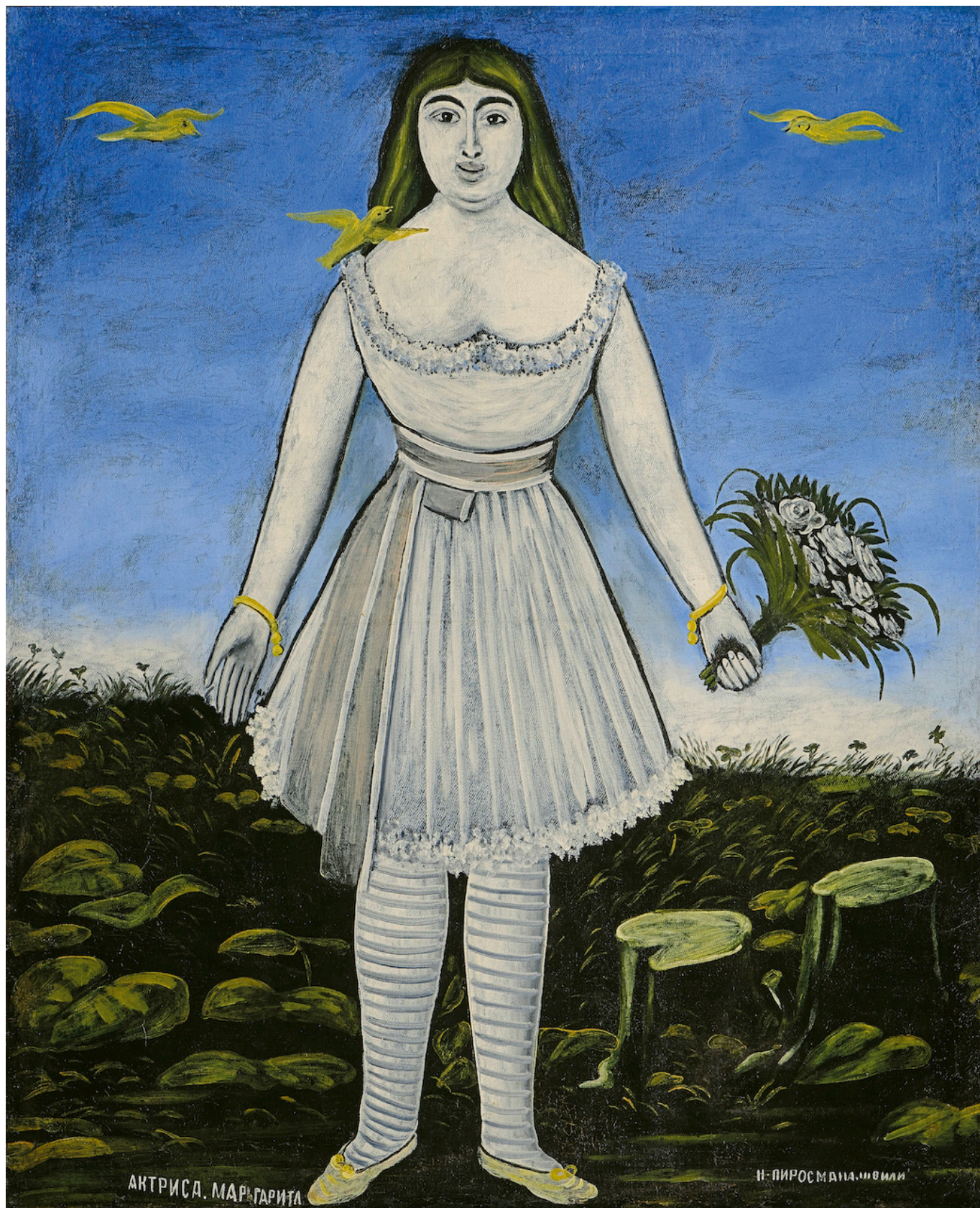
Нико Пиросмани. Актриса Маргарита. The Collection of Shalva Amiranashvili Museum of Fine Arts of Georgia, Georgian National Museum, Tbilisi

Через несколько дней к гостинице, в которой жила Маргарита, подъехала арба, доверху гружёная цветами. Это были розы, сирень, веточки акации, анемоны, пионы, лилии, маки... Сначала привыкшая к аплодисментам и цветам Маргарита думала, что подарок прислал ей какой-то богатый поклонник. Она даже не догадывалась, что для того, чтобы купить цветы,