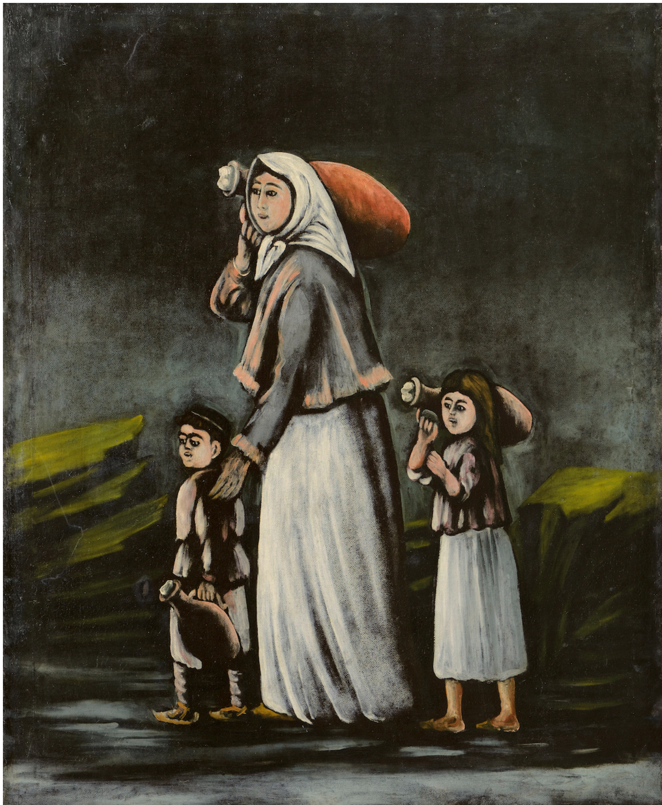
Нико Пиросмани. Крестьянка с детьми идет за водой.

вообще никакого систематического образования не получил, научился читать по-грузински и по-русски, несколько месяцев обучался ремеслу в типографии, какое-то время работал то пастухом, то тормозным кондуктором на железной дороге. И всегда рисовал, хотя до 1912 года никаких контактов с представителями художественных кругов Тифлиса у него не было - он просто понемногу учился живописи у странствующих художников, расписывавших вывески лавок и духанов.