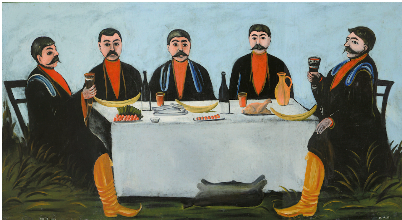
Нико Пиросмани. Застолье пятерых князей The Collection of Shalva Amiranashvili Museum of Fine Arts of Georgia, Georgian National Museum, Tbilisi

Русском музее, крупнейшим в России собранием обладает Московский музей современного искусства. Сейчас ресторанов, вдохновленных Нико Пиросмани и использующих копии его работ в интерьере, видимо – не видимо: мы обнаружили их в Таллине, Франкфурте, Париже, не говоря уже о многочисленных российских городах, от Ярославля и Люберец до Махачкалы. Жаль, что в Швейцарии не появился пока «свой» ресторан Пиросмани, но зато проходит выставка. И не в первый раз. Впервые работы Нико Пиросмани были представлены в Швейцарии в 1995 году, в Кунстхаусе Цюриха: выставка называлась «Zeichen & Wunder. Niko Pirosmani und die Gegenwartskunst», картины Пиросмани соседствовали с картинами современных художников. С тех пор – ничего, а ведь за прошедшее время выросло новое поколение любителей искусства.