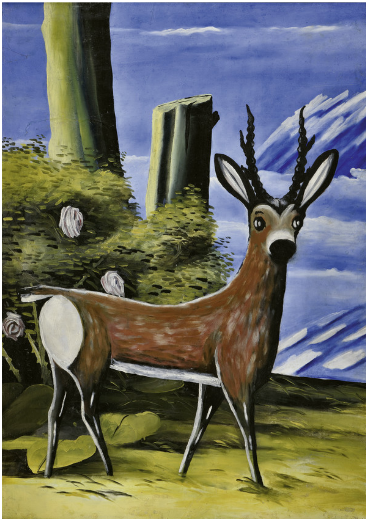
Нико Пиросмани. Косуля на фоне пейзажа, 1913 г. The Collection of Shalva Amiranashvili Museum of Fine Arts of Georgia, Georgian National Museum, Tbilisi

Несмотря на суровые жизненные условия, один из самых устойчивых сюжетов творчества Пиросмани – сцены праздников или пиров: можно представить себе, как текли слюнки у вечно полуголодного художника во время работы над этими картинами. Второй популярный сюжет – животные, часто очень похожие друг на