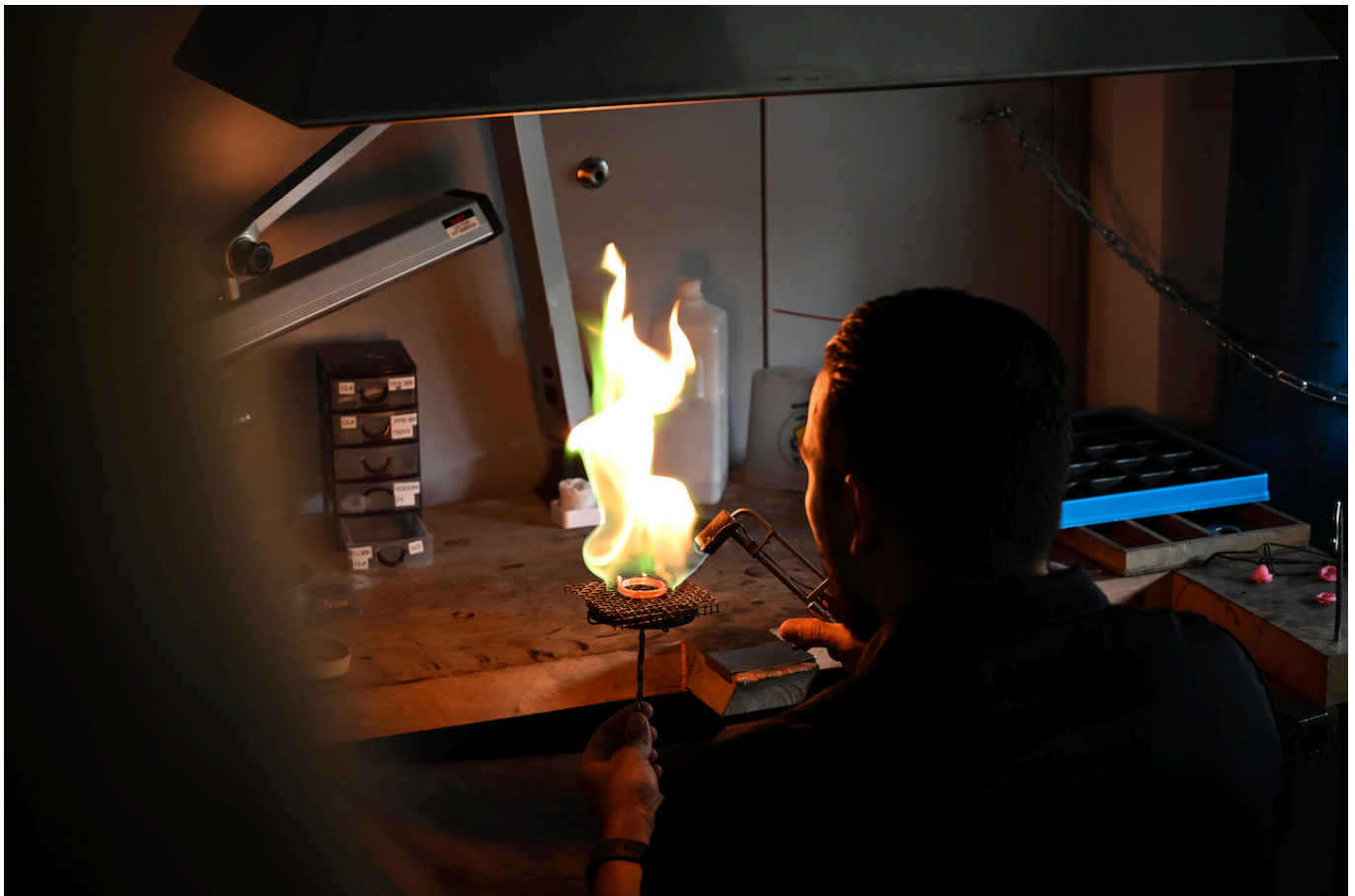
Так рождается часовой корпус

Среди постоянных партнеров бренда (так и хочется сказать «поставщиков двора Его Часового Величества Ф.П. Журна») - уникальные ремесленники: специалисты по изготовлению сложных драгоценных корпусов, объединенные под вывеской мастерской Les Boitiers-Genève SA, и циферблатов - Les Cadraniers de Genève. Обе мастерские обосновались еще в 2012 году в женеvской коммуне Meyrin, известной на весь мир благодаря расположенному здесь ЦЕРНу, а в прошлом году прославившейся еще и за счет Премии Ваккера , присуждаемой Ассоциацией культурного наследия Швейцарии (Patrimoine Suisse) швейцарским муниципалитетам, которым удается сохранять аутентичность и при этом идти в ногу со временем.