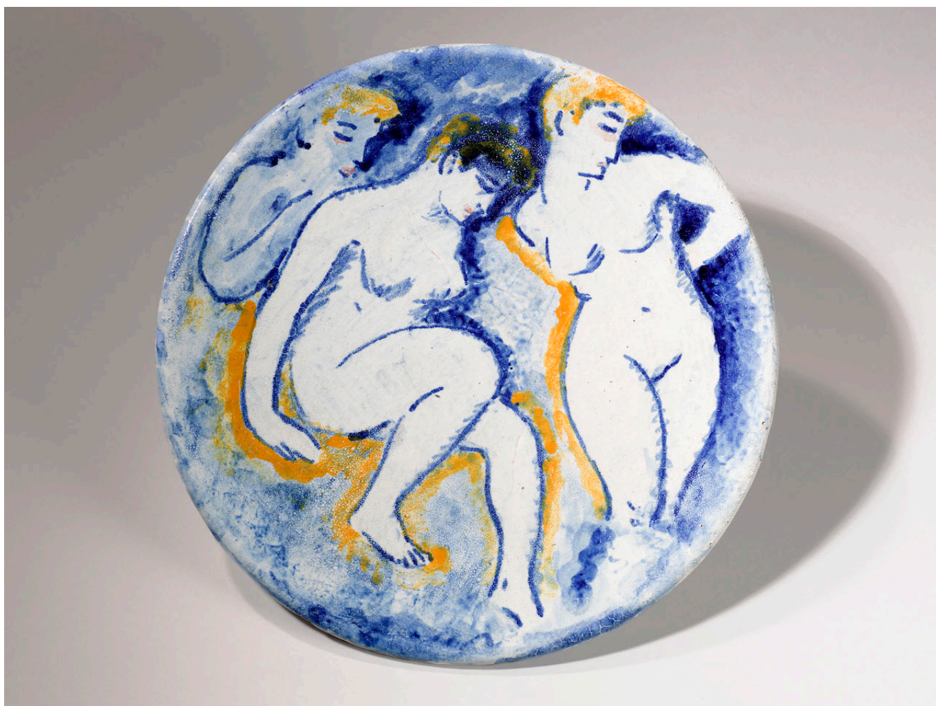
Кис Ван Донген. Тарелка, ок. 1907-1909 гг.

Излюбленными сюжетами фовистов были берега Сены и деревушки Шату: Пек, Аржатёй, уголки Нормандии, ночной мир с его кабаре и цирками, проститутками и канатоходцами, «девочками» и пьяницами, а также обнаженные натуры и портреты.