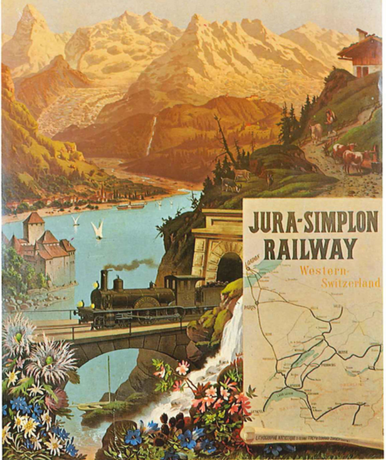
Железные дороги проложили путь массовому туризму. Старинная афиша