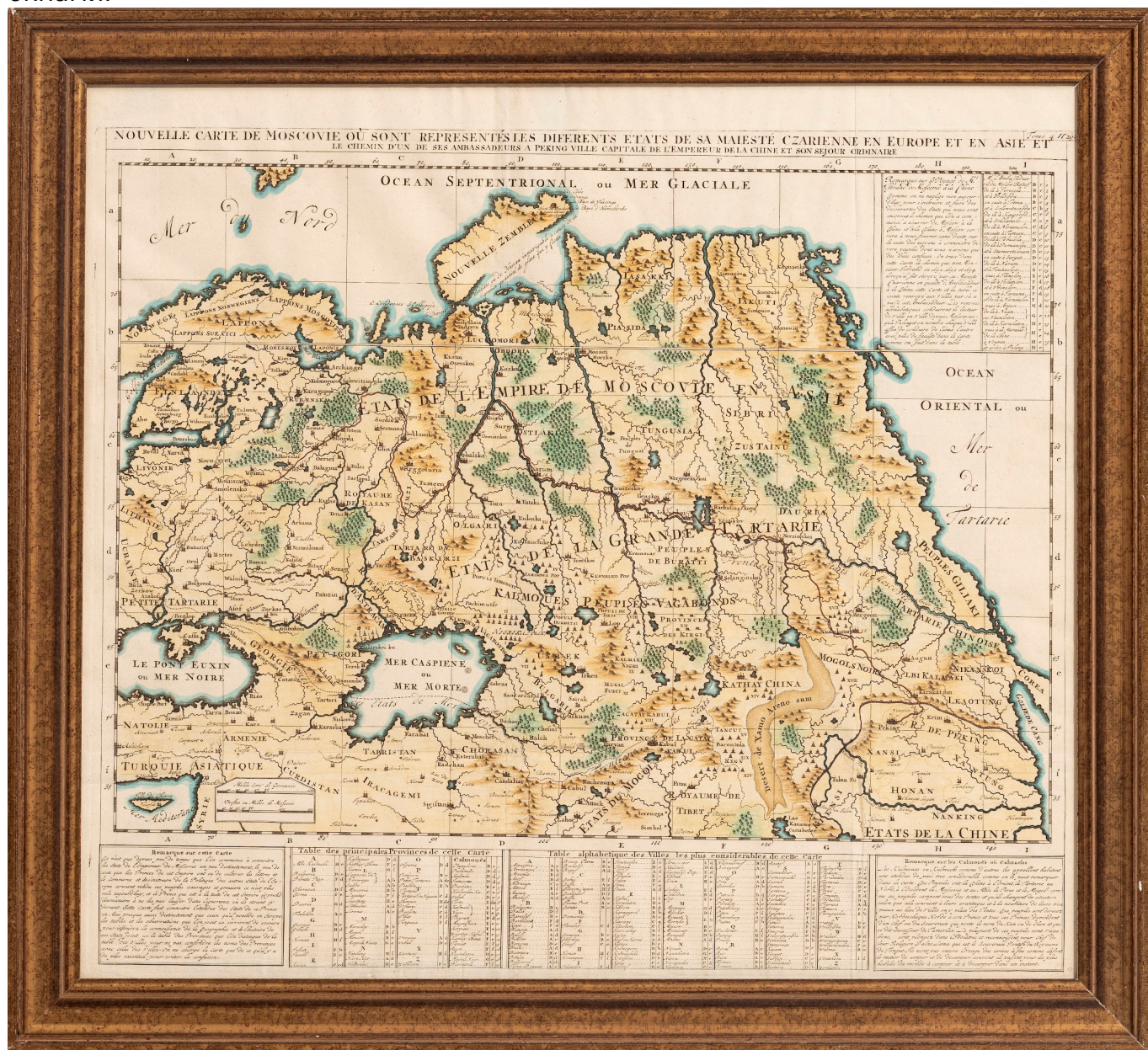
Новая карта Московии. Амстердам, 1718-1720 гг.

хранящейся в Историческом музее Лозанны и изображающей рабочий кабинет Лагарпа на улице Мартерей, аналогичный портрет Александра I висит между двумя окнами.