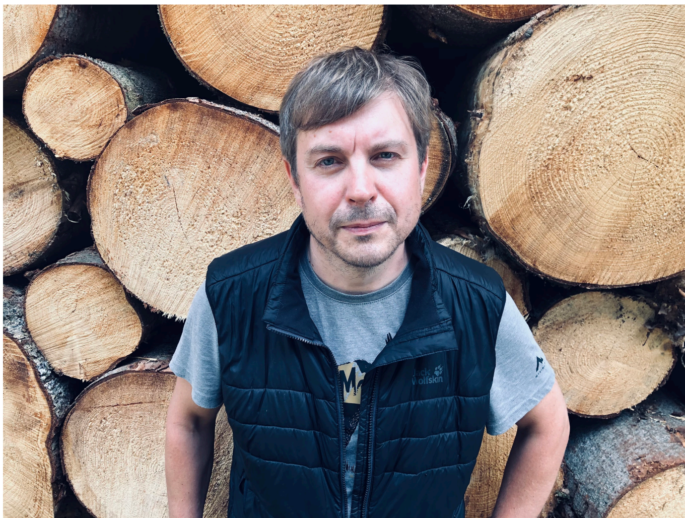
Писатель Сергей Лебедев