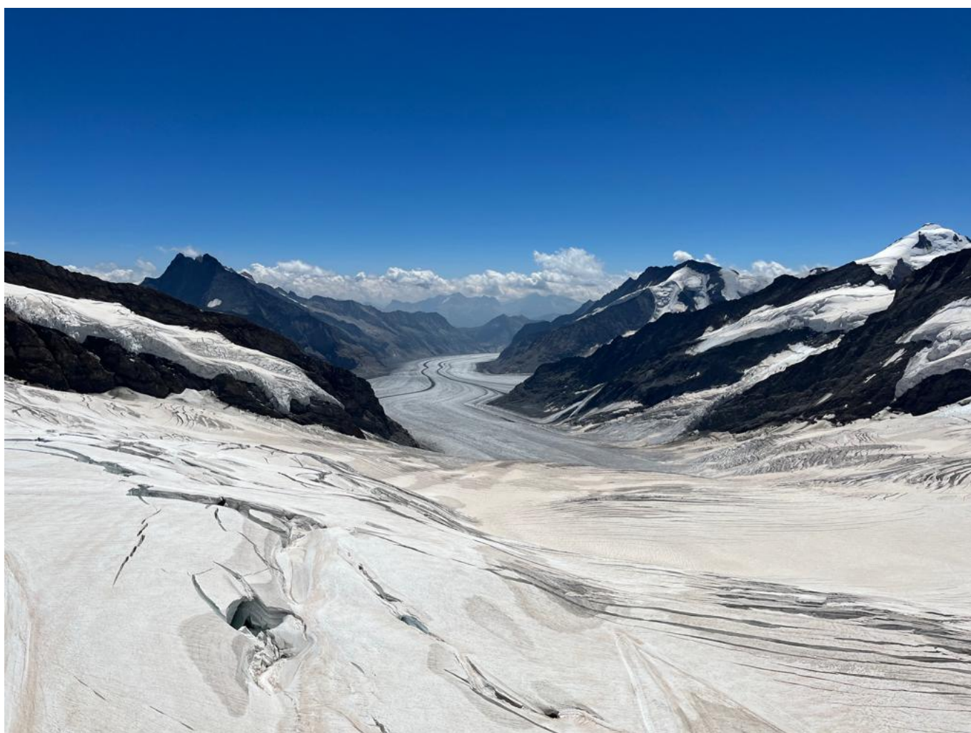
Ледниковая долина

Auteur: Надежда Сикорская, Церматт , 27.07.2022.