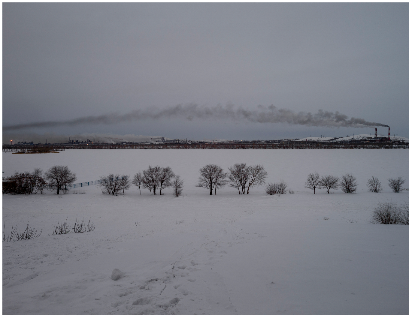
Магнитогорский металлургический комбинат