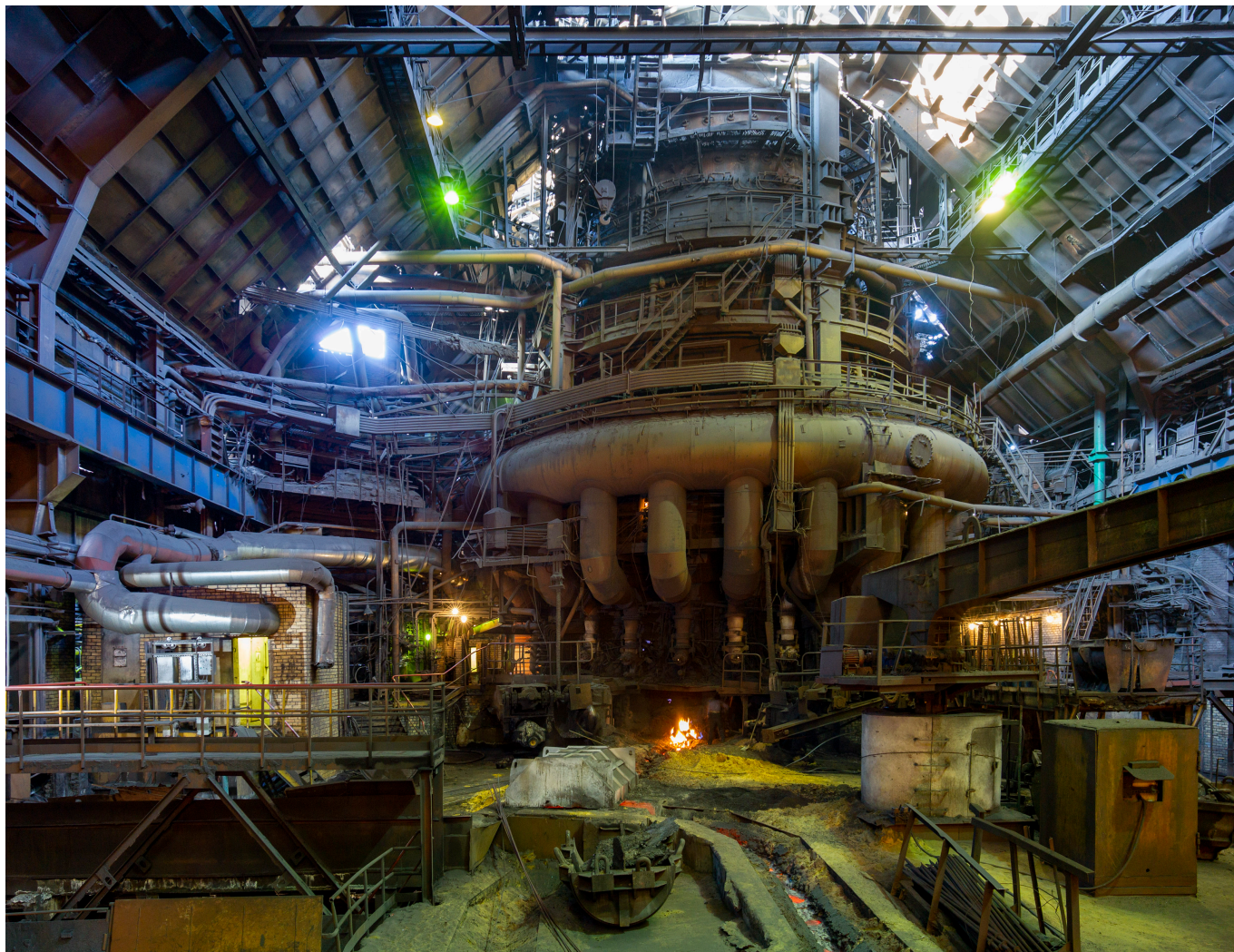
Магнитогорский металлургический комбинат

этого региона в качестве промышленного центра вызывает вопросы у европейцев, ведь на западе производство стремятся располагать поближе к воде, к портам, а не в глубине страны. Петр Первый начал на Урале первую промышленную революцию, ее продолжили большевики, опиравшиеся на рабочий класс. О производстве стали писали во всех учебниках – русские обогнали в свое время англичан и американцев. Урал – это хребет России, через который прошли все этапы ее истории.