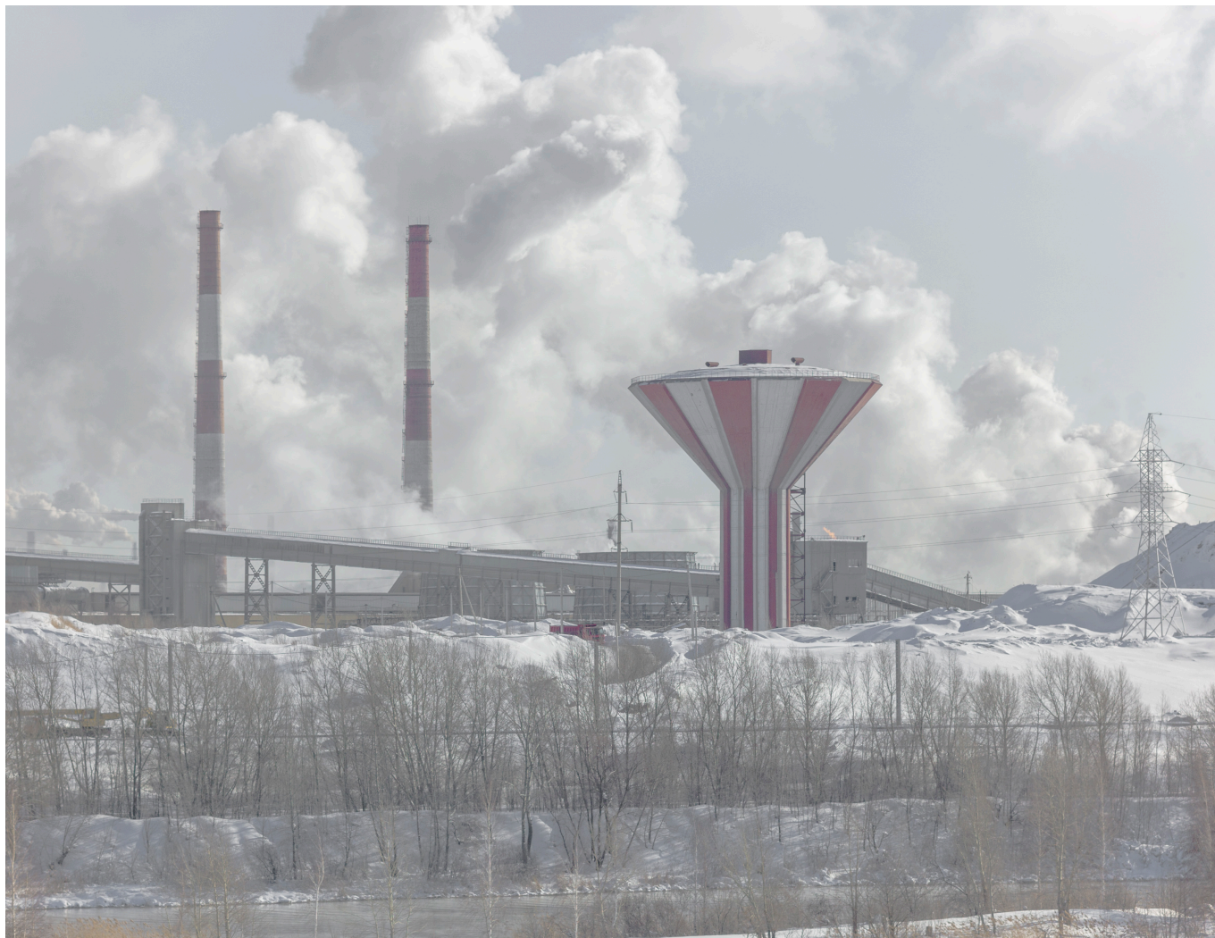
Магнитогорский металлургический комбинат

Седрик, с точки зрения сегодняшнего дня особенно горько звучат Ваши слова о советских и западных интеллектуалах, от Ильи Эренбурга до Луи Арагона, поддавшихся пропаганде 1930-х годов. Сборник стихов Арагона «Ура, Урал!» 1932 года Вы называете «шедевром идеологической слепоты». Думаете ли Вы, что кого-то еще вводит в заблуждение сегодняшняя пропаганда России, также преисполненная милитаристских лозунгов?