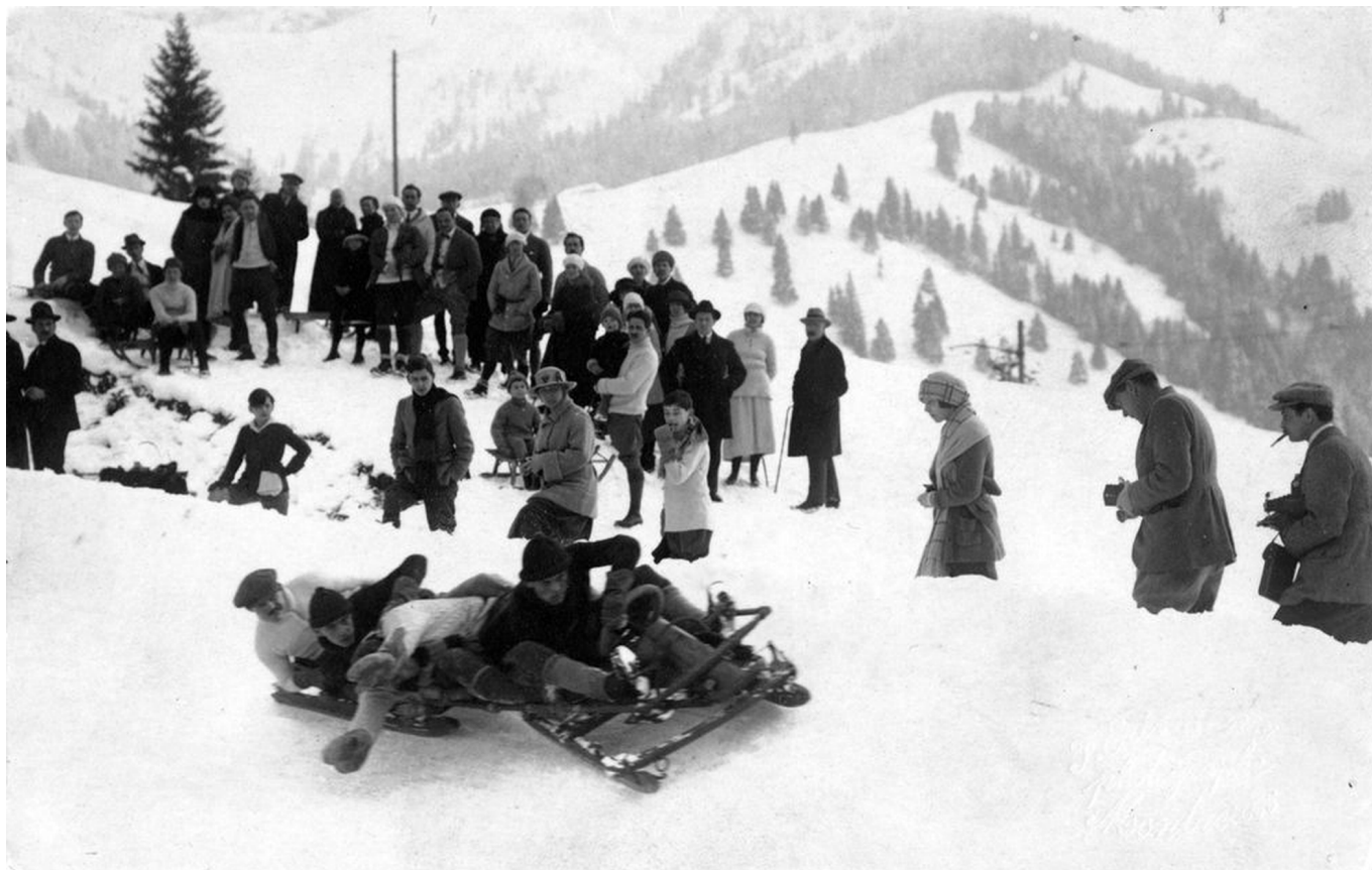
Эрнст Хемингуэй участвует в соревновании на тобогганах.

Такое детальное описание местности свидетельствуют о том, что и сам автор романа здесь бывал. Это действительно так. Хемингуэй прекрасно знал Лез Аван. Судя по всему, ему там очень нравилось. Подтверждений этому немало. Есть они, например, в книге воспоминаний «Праздник, который всегда с тобой». Описывая свою жизнь в Париже с первой женой Хэдли в 1920-х годах, Хемингуэй вспоминает, как дождливой осенью мечтал о поездке в Швейцарию: «У подножия Лез-Авана есть шале, где прекрасно кормят, где мы будем вдвоем и с нами будут книги, а по ночам нам будет тепло вдвоем в постели, и в открытые окна будут сиять звезды. Вот куда мы поедем. Если взять билеты третьего класса, это будет недорого. А за пансион придется платить лишь немногим больше того, что мы тратим в Париже».