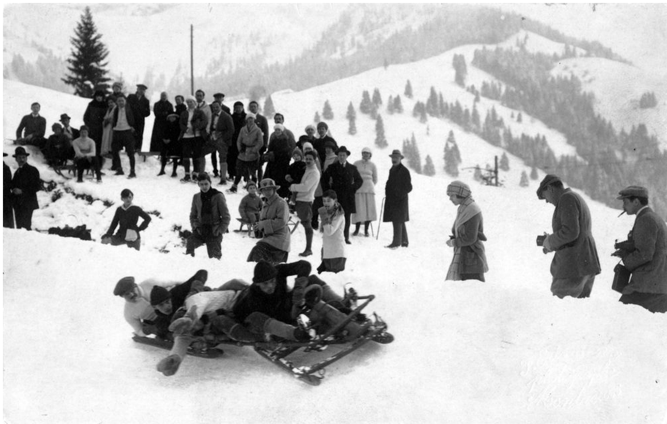
Эрнст Хемингуэй участвует в соревновании на тобогганах.

Такое детальное описание местности свидетельствуют о том, что и сам автор романа здесь бывал. Это действительно так. Хемингуэй прекрасно знал Лез Аван. Судя по всему, ему там очень нравилось. Подтверждений этому немало. Есть они, например, в книге воспоминаний «Праздник, который всегда с тобой». Описывая свою жизнь в Париже с первой женой Хэдли в 1920-х годах, Хемингуэй вспоминает, как дождливой осенью мечтал о поездке в Швейцарию: «У подножия Лез-Авана есть шале, где прекрасно кормят, где мы будем вдвоем и с нами будут книги, а по ночам нам будет тепло вдвоем в постели, и в открытые окна будут сиять звезды. Вот куда мы поедем. Если взять билеты третьего класса, это будет недорого. А за пансион придется платить лишь немногим больше того, что мы тратим в Париже».