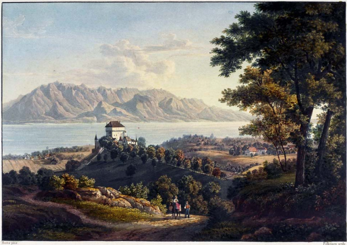
CHÂTEAU DE CHATELARD .

Шато дю Шатлар. Гравюра середины 19 века, раскрашенная акварелью