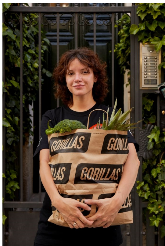
Доставка еды за 10 минут