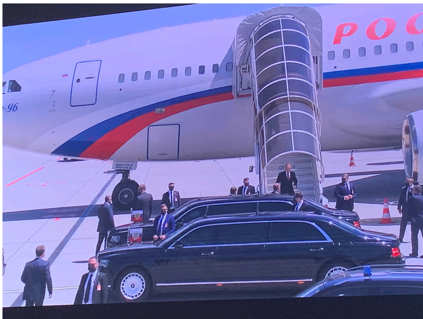
Президент Путин решил обойтись без протокола

Но вернемся... Легко сбежав по приставным ступенькам, Владимир Владимирович махнул – приветственно – рукой, и, словно по пресловутой Питерской, понесся по безлюдной Женеве на встречу с Джо Байденом.