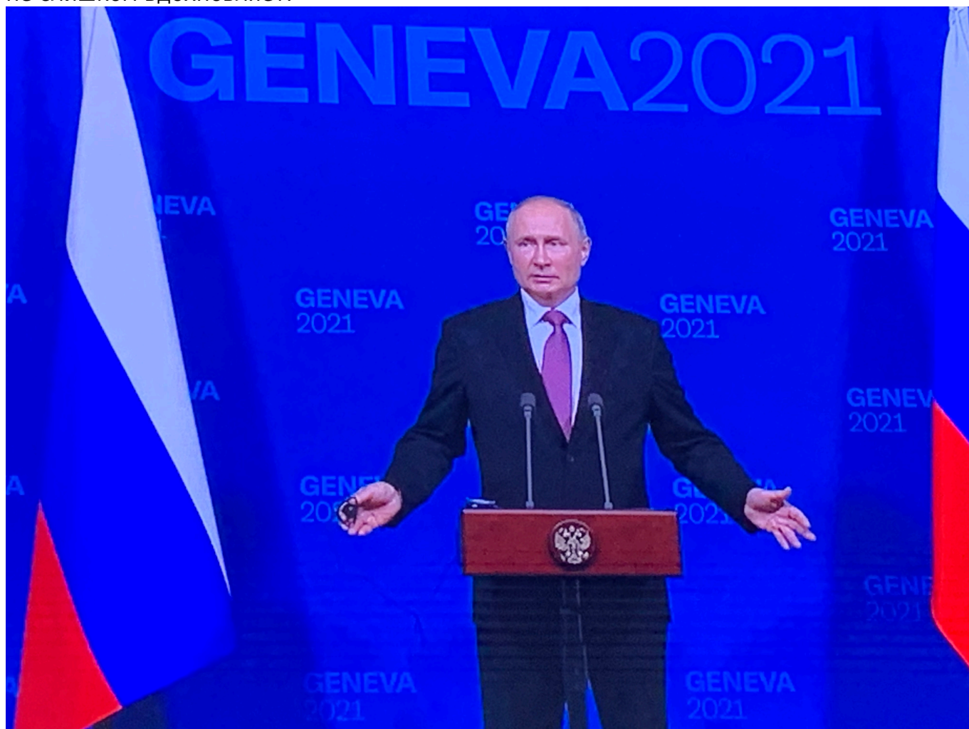
В. В. Путин после встречи с Джо Байденом.

Обсуждался и вопрос обмена заключенными - по словам президента Путина, здесь «могут быть найдены компромиссы». Будем ждать конкретики. Но итоговым заявлением В. В. Путина мы считаем безапелляционное: «иллюзий нет, и быть не может». Завершая вчерашний день в студии RTS ( https://www.rts.ch/play/tv/emission/19h30?id=6454706 ), мы прокомментировали, в частности, именно эту фразу. Действительно, главе государства не обязательны иллюзии, тем более, что они имеют тенденцию разбиваться. Но видение мира ему необходимо! Увы, «картинка мира», рисуемая как одним президентом, так и другим не слишком вдохновляет.