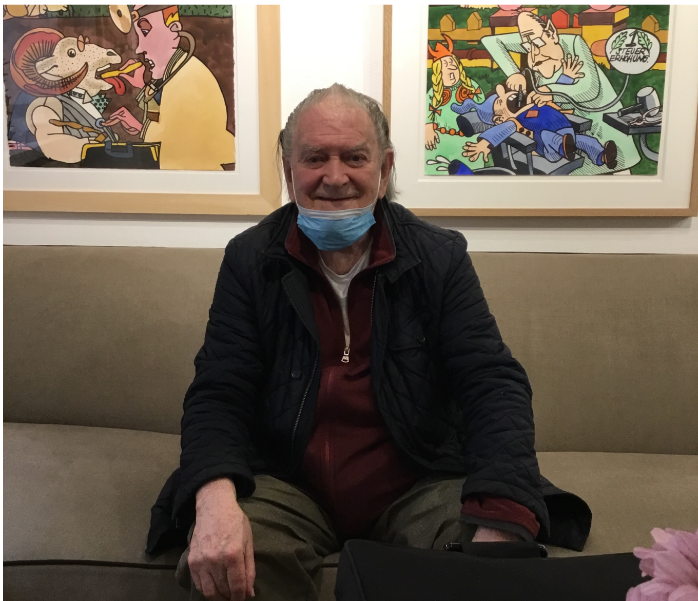
Художник Эрро на вернисаже в Женеве, 20 мая 2021 г.