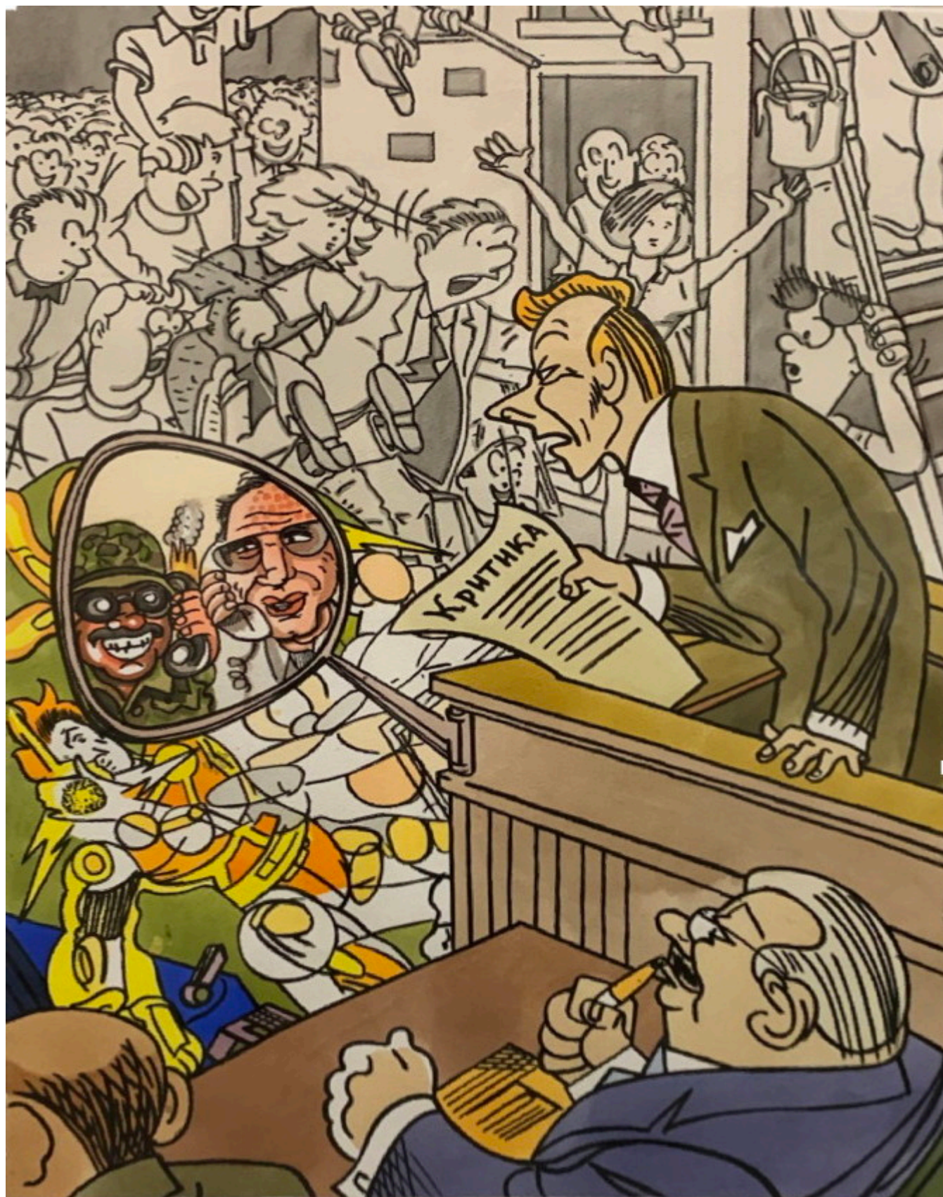
Эрро. Контакт с мафией, 1987 г.