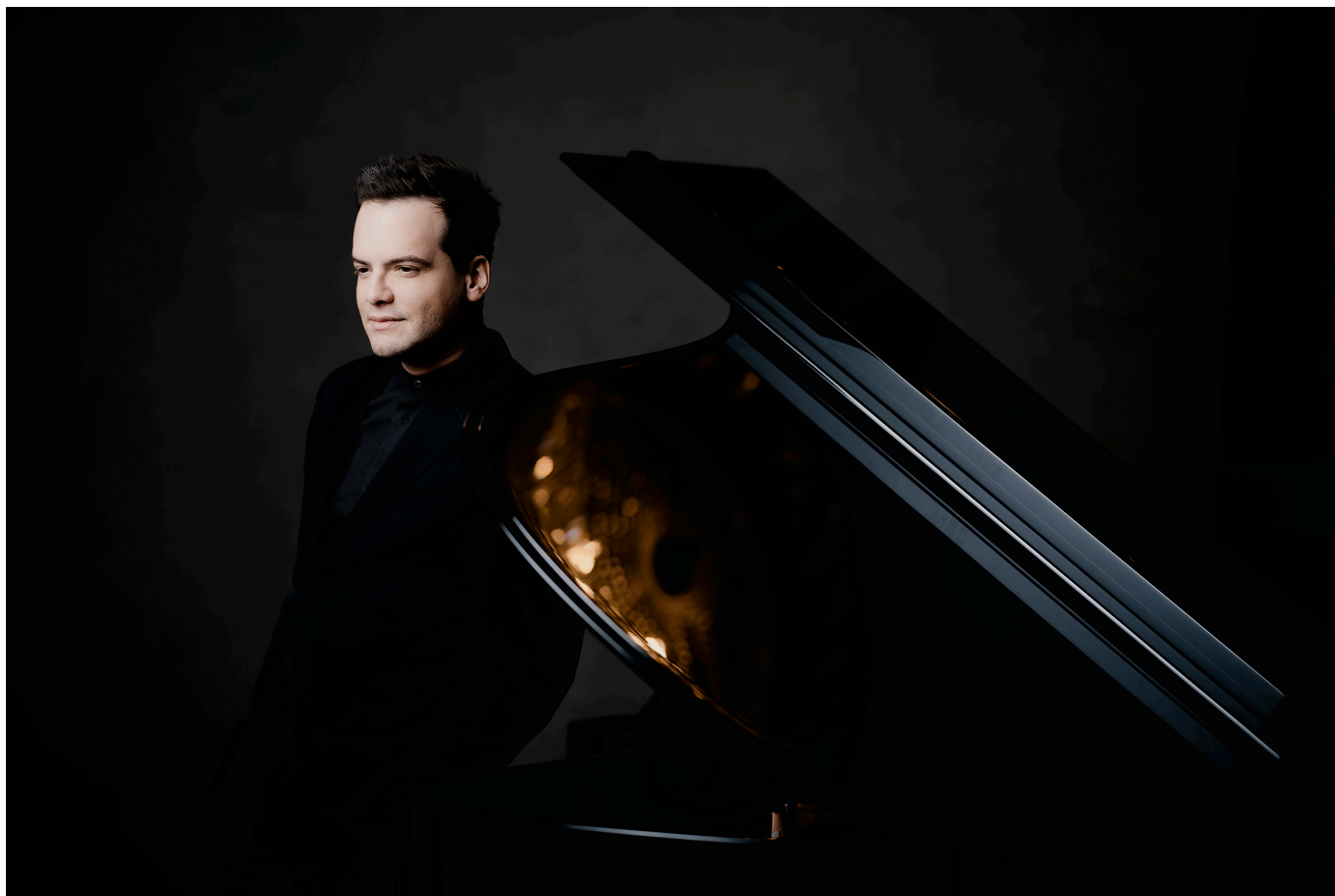
Пианист Франческо Пьемонтези

Мы очень надеемся, что наши любящие классическую музыку читатели имели возможность посмотреть более удачную постановку «Русалки», чем та, которую довелось как-то рецензировать нам, и что у них великолепная музыка Дворжака ни с какими неприятными визуальными впечатлениями не ассоциируется. А если и так, то забудьте о них, не стоят преходящие режиссерские фантазии вечного удовольствия! Так что настраивайте, так сказать, транзисторы и внимайте.