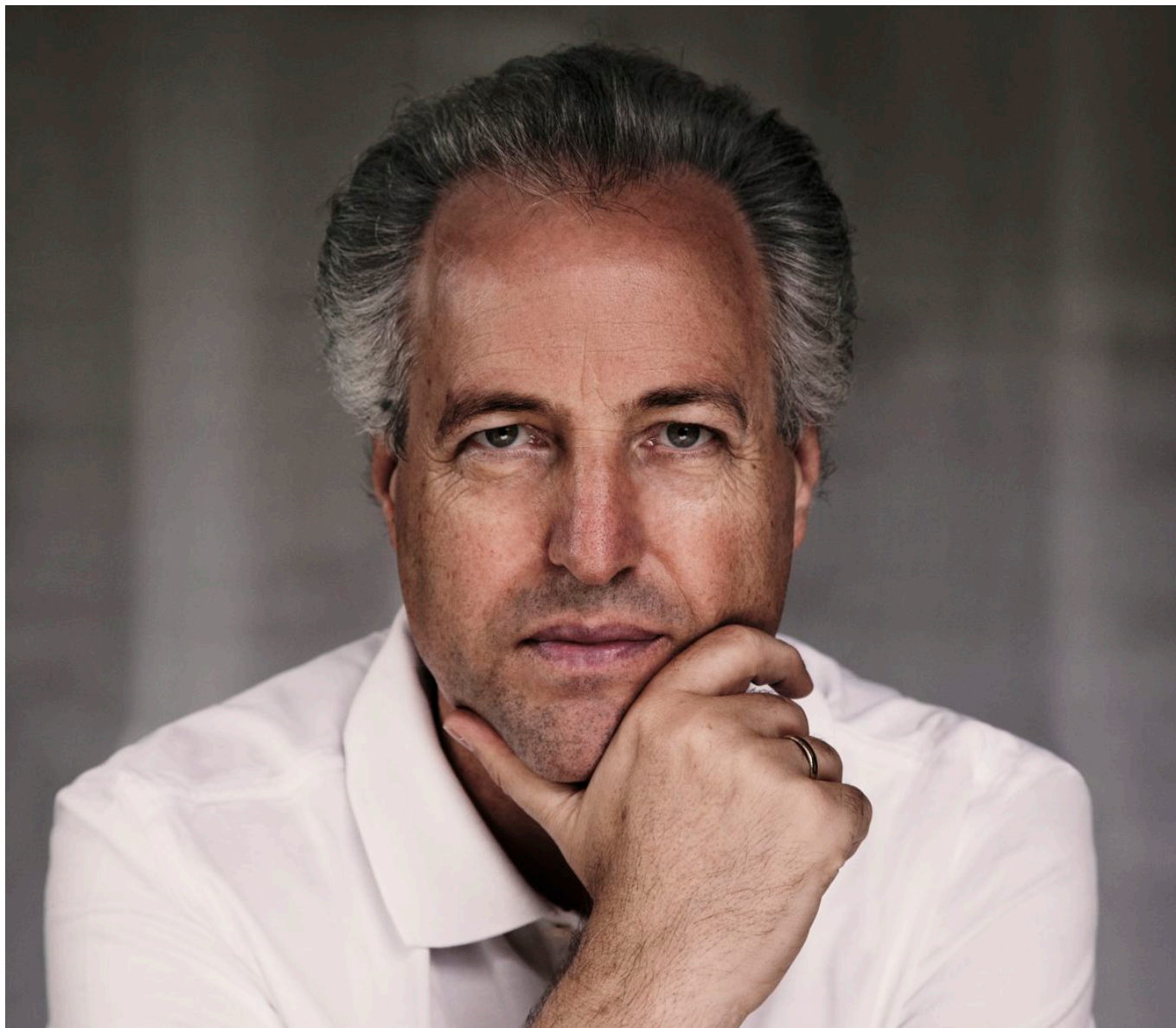
Дирижер Манфред Хонек

Прямую трансляцию концерта Оркестра Романдской Швейцарии, в программу которого включены два шедевра русской классики, можно будет послушать 29 января в 20 часов на радиостанции Espace 2, а затем, в течение месяца, на платформе RTS Play .