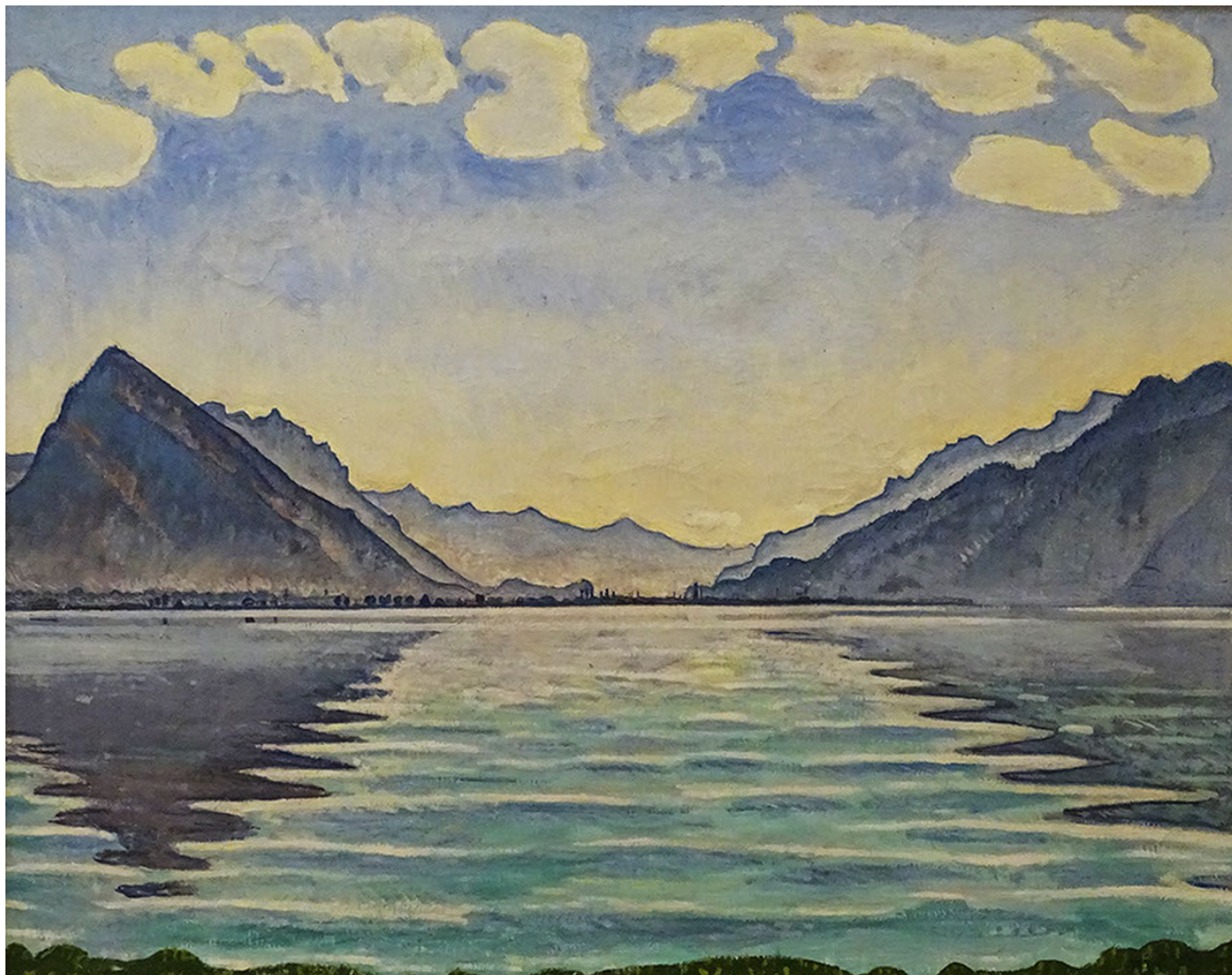
Ф. Ходлер. «Озеро Тун. Симметричное отражение», 1905 г.

Ходлер восхищается красотой родной страны, но главной темой его творчества является человек как часть мироздания. В этом смысле творчество Ходлера – своеобразная переключка с мастерами эпохи Возрождения. Очень важно и то, что человек показан в единстве с природой – только там возможна подлинная жизнь души, рождение идеального человека. Эта позиция Ходлера вполне соответствует философии Руссо , стоявшего у истоков «швейцарского мифа».