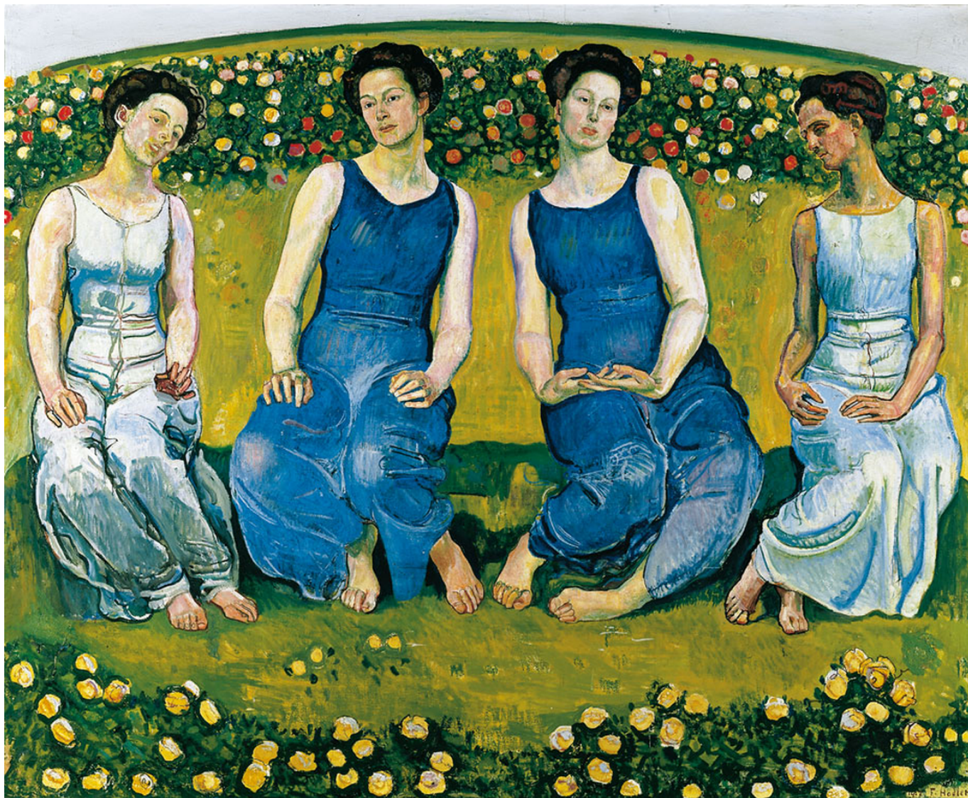
Ф. Ходлер. «Священный час», 1907-1913 гг.

В 1895-1896 годах художник создает двадцать шесть фигур, олицетворяющих Швейцарию, для Дворца изящных искусств Женевы, воздвигнутого на площади Пленпале по случаю проведения Национальной выставки. На красочных панно Ходлер изобразил своих современников – крестьян, ремесленников, воинов. Впервые общественное здание должны были украсить не помпезные аллегорические фигуры или альпийские пейзажи, а изображения простых людей. Подобный подход, естественно, встретил непонимание большинства членов комиссии, принимавших работы. Восемь полотен были отвергнуты, в другие следовало внести изменения. Сегодня несколько работ этой серии украшают здание Музея искусства и истории Женевы.