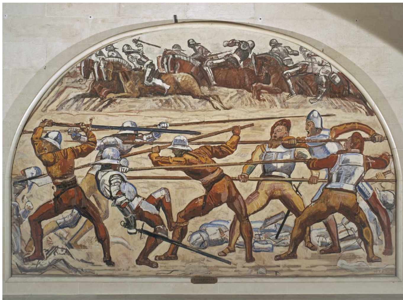
Ф. Ходлер. «Битва при Мюртене», 1917 г. © Музей искусства и истории, Женева

Auteur: Наталья Беглова, Женева , 12.02.2021.