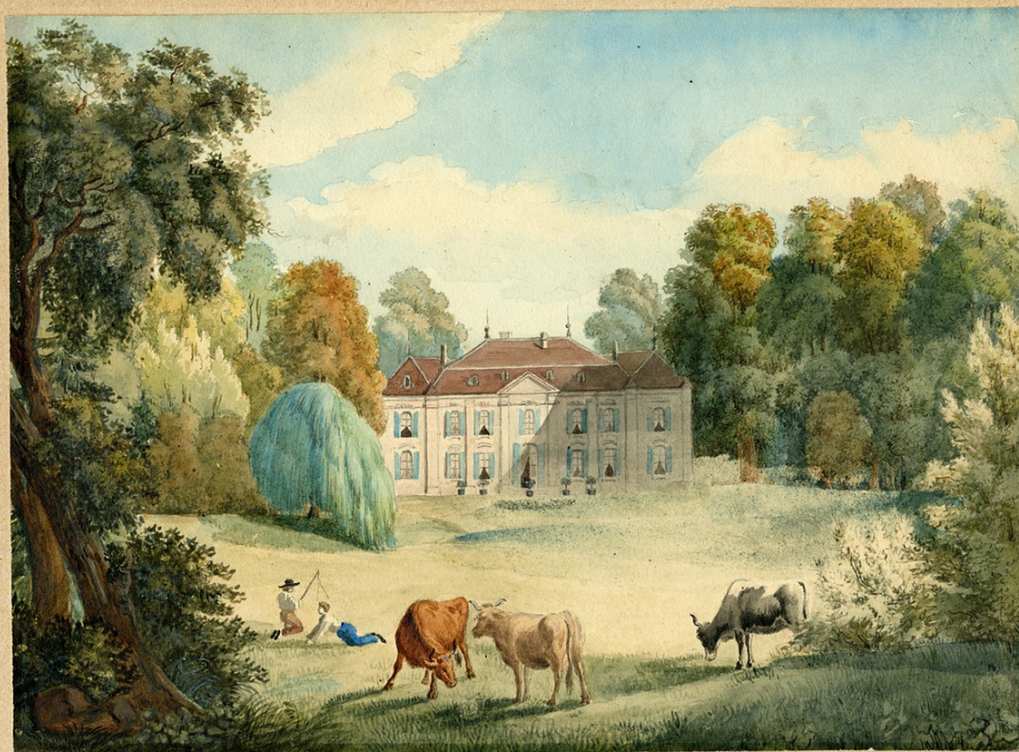
Boissière Route de Chêne (près Genève)

Зачем понадобился Герцену такой большой дом? Дело в том, что он вернулся в Женеву не один, а с новой спутницей жизни – Натальей Алексеевной Тучковой-Огаревой. Как вы помните, Герцен пережил трагический опыт вторжения в его семейную жизнь Георга Гервега. Правда, Гервегу не удалось разрушить семью Герцена. Зато в Лондоне сам Александр Иванович разбил семью своего ближайшего друга и соратника Николая Огарева. В 1857 году Наталья Алексеевна стала фактической женой Герцена. При этом, как и в истории с «Гнездом близнецов», все продолжали жить под одной крышей. С той разницей, что Огарев с самого начала был в курсе сближения его жены с другом. Он тяжело переживал ситуацию, начал злоупотреблять алкоголем.