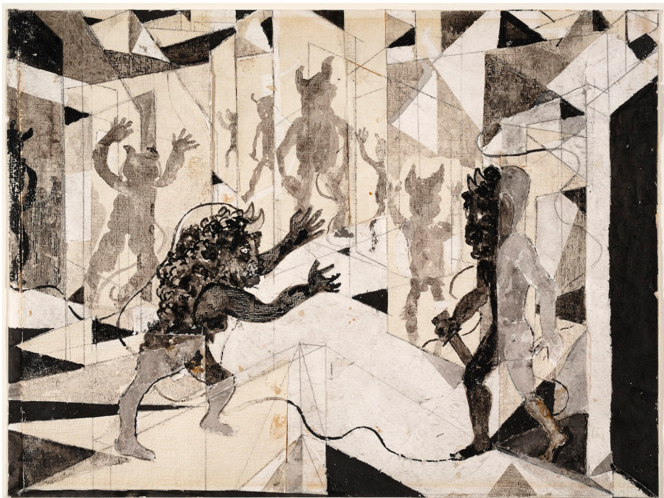
Friedrich Dürrenmatt, Illustration pour la Ballade Minotaure VII, 1984-85, encre de Chine sur papier, 40 × 30 cm, CDN © CDN / Confédération suisse

Дюрренматт интересовался, в первую очередь, драматургическим потенциалом создаваемых им образов. Он, несомненно, находился под влиянием экспрессионизма, отмечают эксперты, а также добавляют, что глубокое влияние на его творчество оказали Иероним Босх, Питер Брейгель, Джованни Пиранези, Франсиско Гойя и швейцарский художник-фигуративист Вилли Гуггенхайм, более известный под псевдонимом Варлен, с которым писатель поддерживал дружеские отношения.