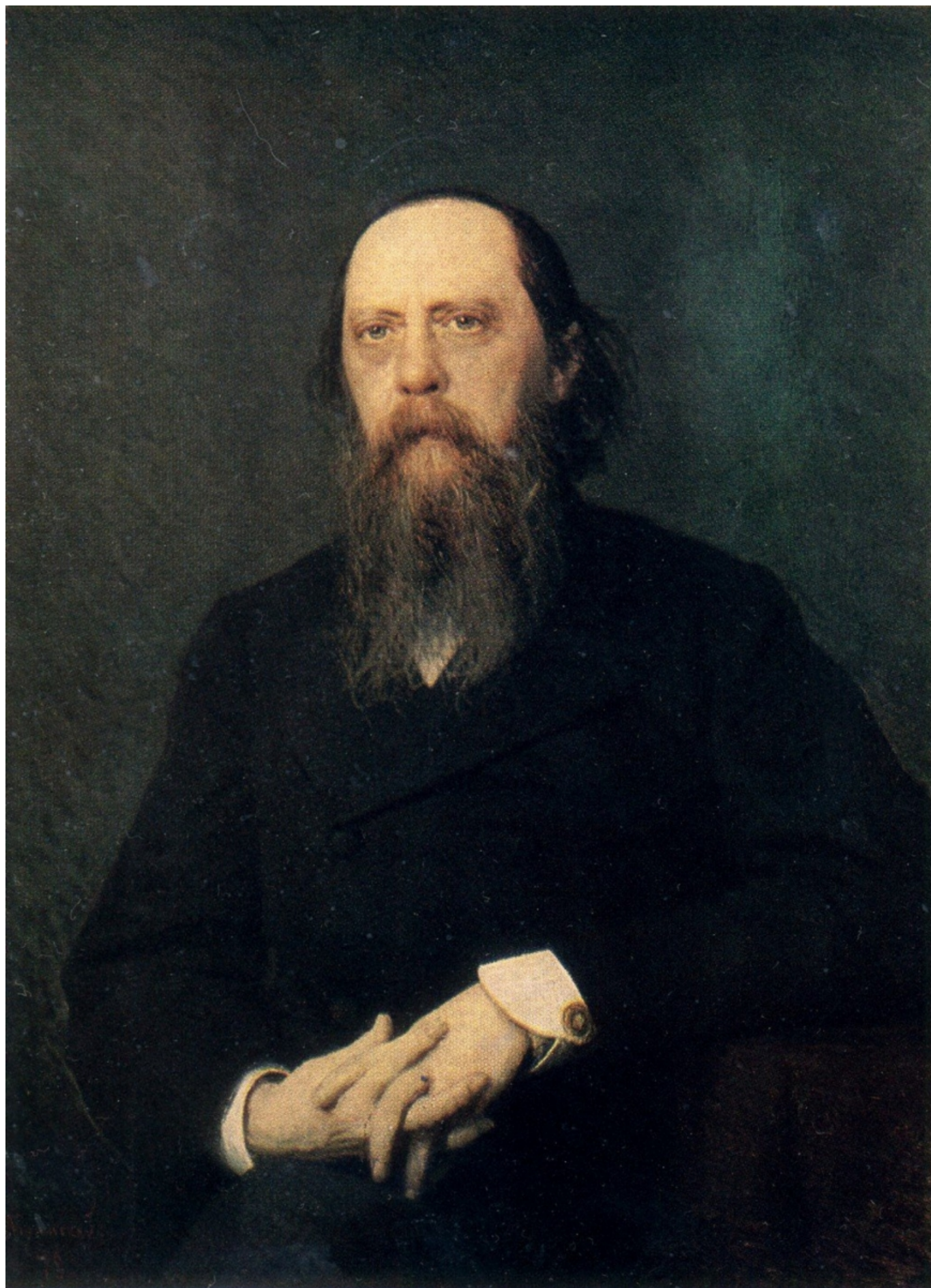
Иван Крамской. Портрет писателя М.Е. Салтыкова-Щедрина. 1879 г. , Государственная Третьяковская галерея, Москва