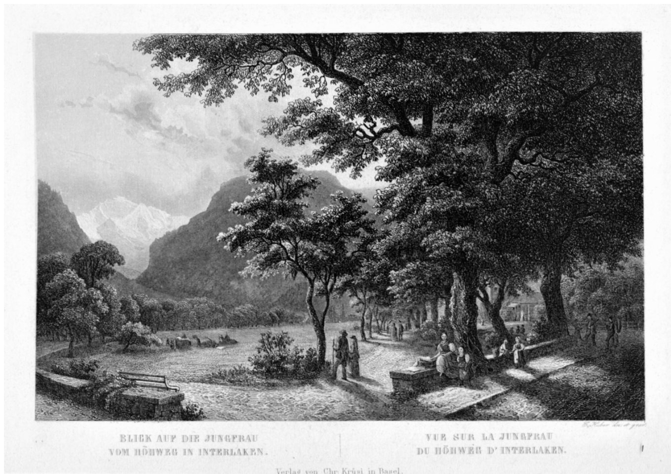
Интерлакен. Вид на Юнгфрау. Старинная гравюра из коллекции автора

О чем же говорит русский человек с мужичками за границей? Как ни странно, в основном о России. Причем не просто говорит, а обсуждает российские проблемы или, по выражению Салтыкова, «сквернословит»: «Ах, и сквернословили же мы в это веселое время! Смешные анекдоты так и лились рекой из уст культурных сынов России. "La Russie... ха-ха!" "le peuple russe... ха-ха!" "les boyards russes... ха-ха!" "Да вы знаете ли, что наш рубль полтинник стоит... ха-ха!" "Да вы знаете ли, что у нас целую губернию на днях чиновники растащили... ха-ха!»