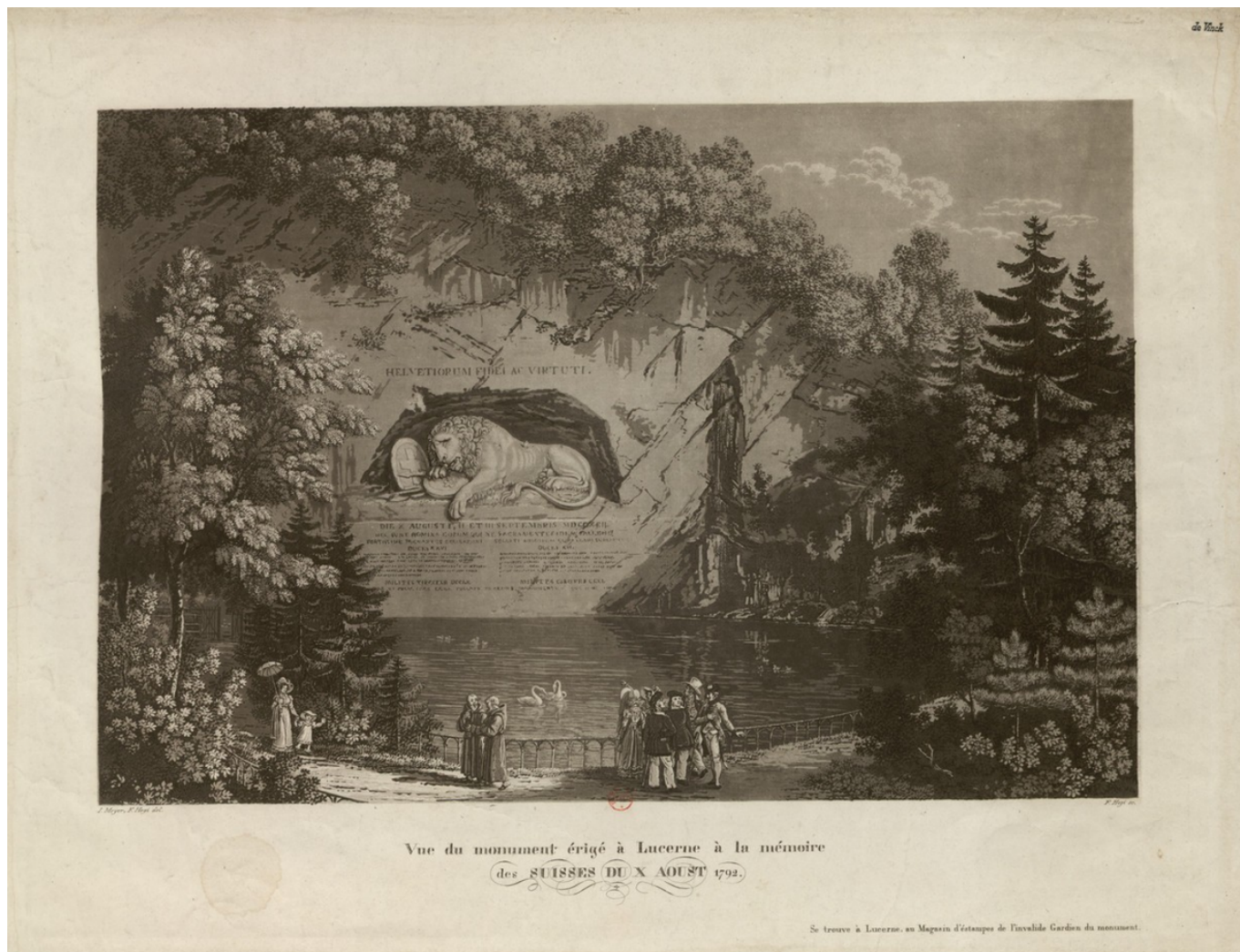
«Умиравший лев» в городе Люцерн. Старинная гравюра из коллекции автора

Отдельные очерки из книги «За рубежом» начали печатать «Отечественные записки» в 1880 году, и никаких проблем с цензурой, как опасался Салтыков, не возникло. Уже первая глава привлекла большое внимание и, как отмечали современники, имела «настоящий, в полном значении этого слова, un succès fou, по крайней мере, в петербургской журналистике и петербургских салонах». Так, например, газета «Сын отечества» писала, что в новом сочинении Салтыков продолжает свою «великую борьбу» за сохранение «живых сил» русского общества: «Читая его, как-то оживаешь, чувствуя, что не все еще заглохло, не все пришиблено, не все искалечено». Последние части произведения писались и печатались уже после убийства народовольцами в Александра II в марте 1881 года и последовавшим за этим повсеместным ужесточением цензуры. Тем не менее, в сентябре 1881 года книга «За рубежом» все-таки вышла отдельным изданием, правда, больше при жизни автора не издавалась.