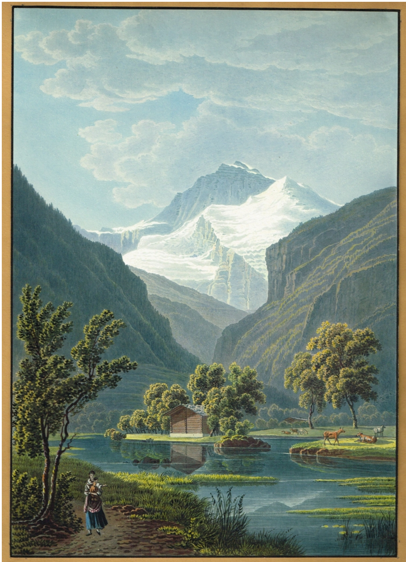
Гора Юнгфрау. Старинная гравюра, раскрашенная гуашью