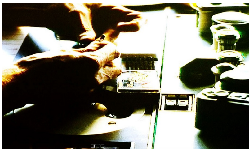
Кадр из фильма «Книга образа»

На первый взгляд «Книгу образа» можно сравнить с картиной Дзиги Вертова «Человек с киноаппаратом» (1929): здесь тоже все время сменяют друг друга разные сцены, мы видим мир таким, какой он есть, без попытки его приукрасить. При этом цель Вертова заключалась в том, чтобы продемонстрировать впечатляющие возможности киноязыка, принципиально отличные от возможностей литературы и театра, тогда как Годар дает нам своеобразное осмысление современного мира во всей его неоднозначности.