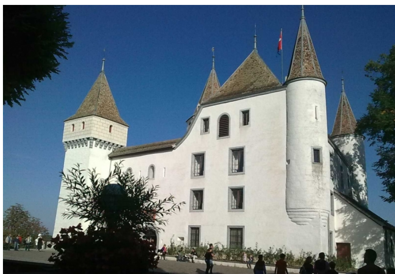
Нионский замок

Мэтр Жан-Люк Годар , стоявший у истоков французской новой волны в кинематографе, в представлении не нуждается. Наша Газета рассказывала о его фильме «Книга образа» (франц.: Le livre d'image), премьера которого прошла весной 2018 года в Каннах. Картину, которая была награждена специальной «Золотой пальмовой ветвью» (ее вручили впервые), можно назвать революционной. Здесь нет героев и актеров – это последовательность кинематографических, музыкальных, литературных, художественных цитат и отрывков теленовостей, которые сменяют друг друга каждые несколько секунд. Перед нами – коллективная память человечества, в которую Годар погружает зрителя, но ничего не объясняет.