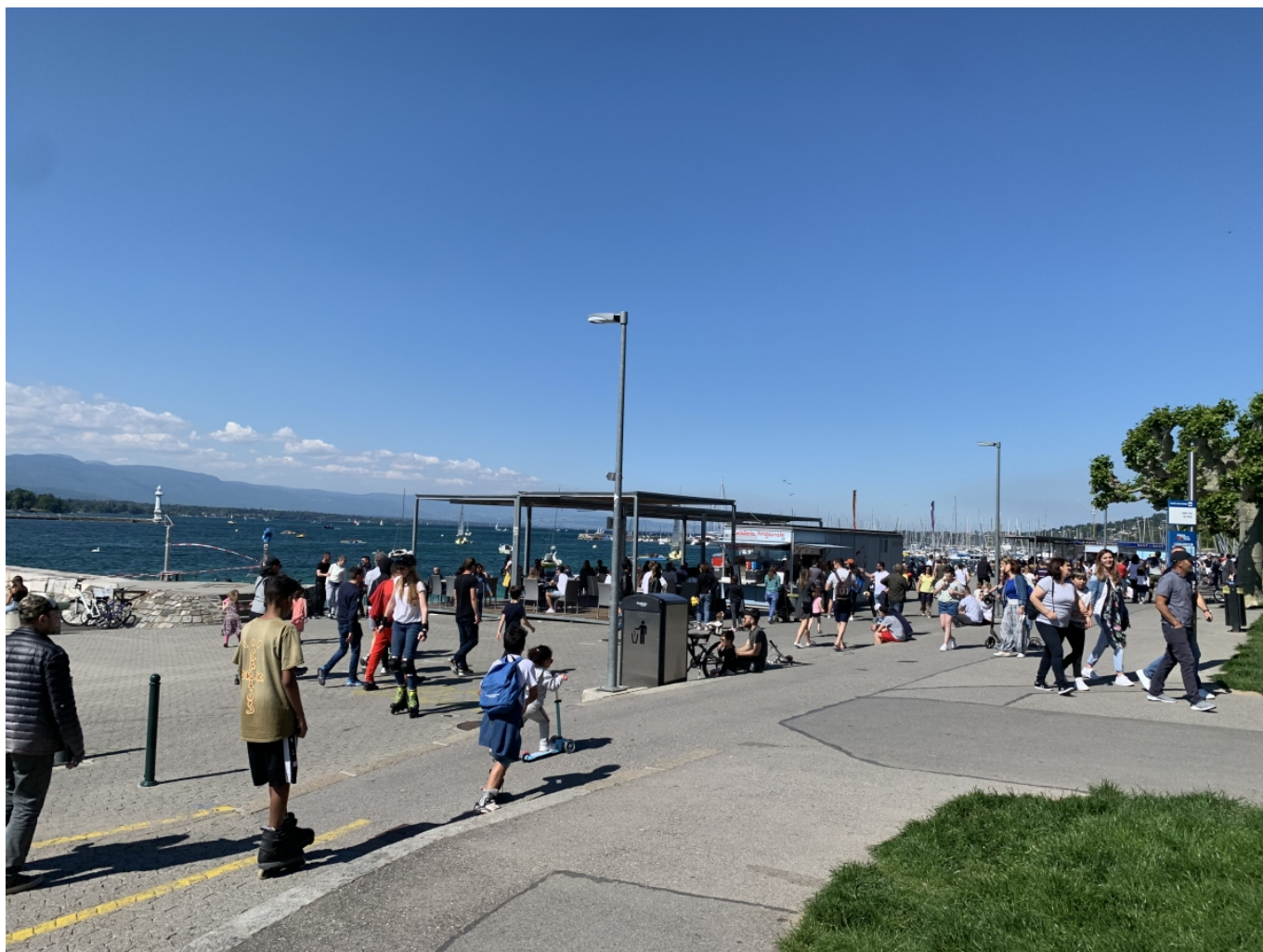
Женевская набережная в воскресенье, 17 мая