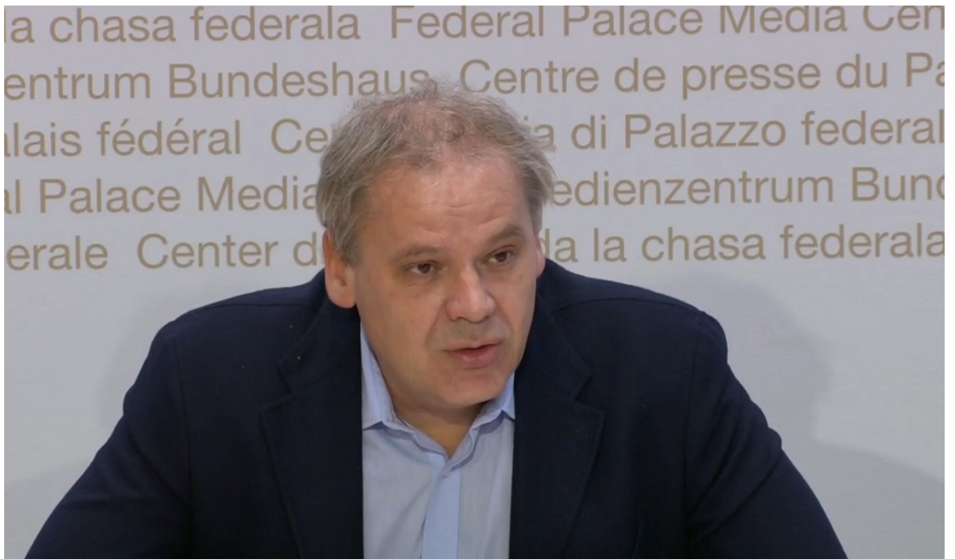
Патрик Матис. Скриншот трансляции брифинга от 20 апреля

К слову, мессы и богослужения также рассматриваются как собрания людей и пока остаются под запретом. Единственное послабление касается похорон: с 27 апреля на них не распространяется ограничение в пять человек, таким образом, прощания могут быть организованы в более широком кругу родных и близких.