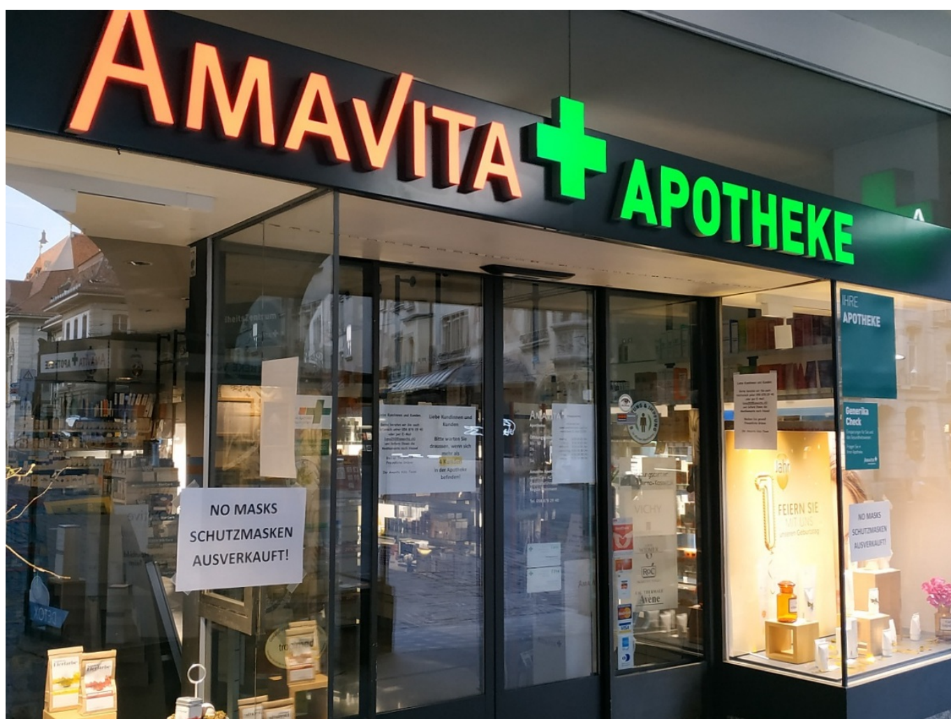
«Масок нет», - гласит объявление на аптеке в Берне.

Наконец, тема ношения масок также поднималась в ходе брифинга. Матис отметил, что маски могут помочь контролировать распространение коронавируса, но подчеркнул, что гигиенические меры являются более эффективными. Напомним, что в Швейцарии ношение масок в общественных местах не является обязательным. OFSP не рекомендует их носить здоровым людям, так как маски не обеспечивают защиту от заражения вирусами, поражающими дыхательные пути. Многие, впрочем, считают, что эта рекомендация связана с тем, что масок просто не хватает.