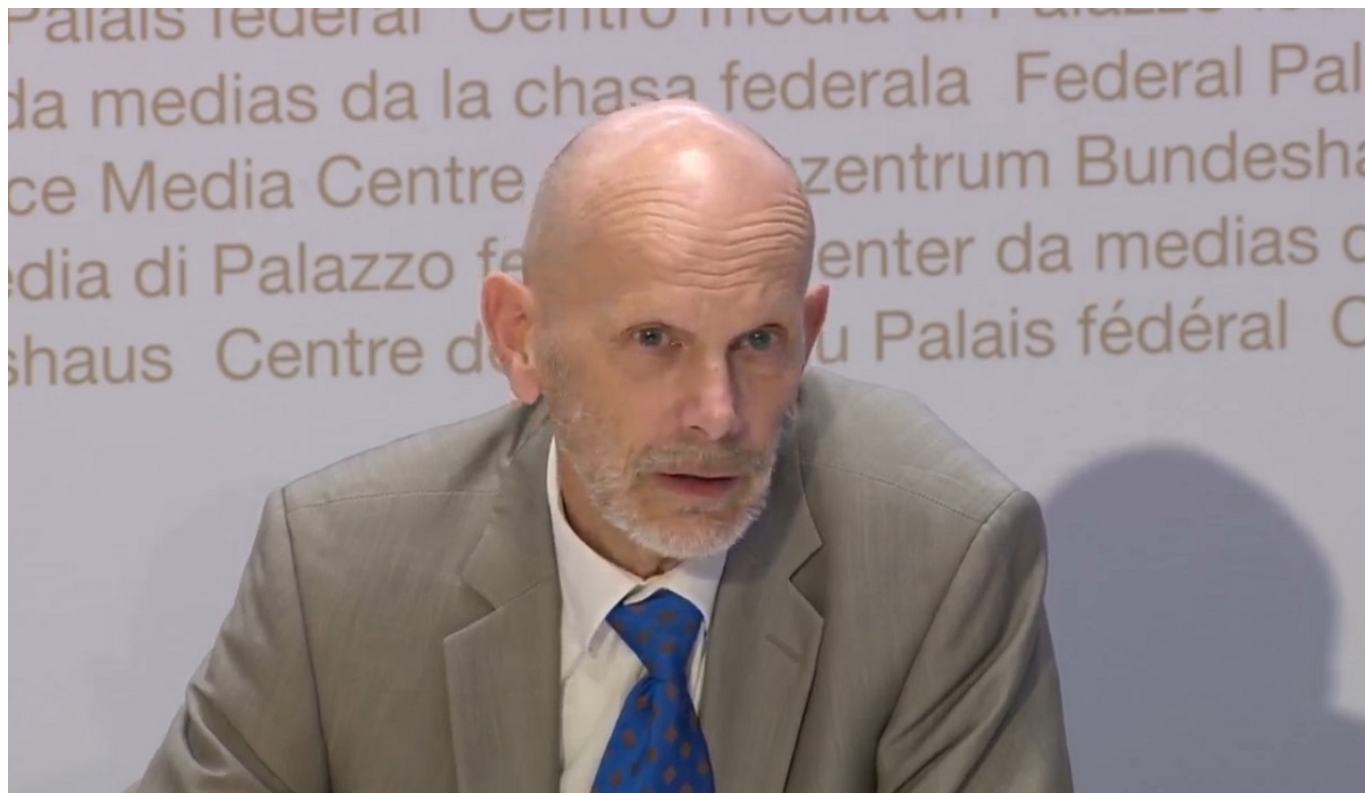
Даниэль Кох. Скриншот трансляции брифинга от 7 апреля

Слава, к которой Кох никогда не стремился, настигла его внезапно: вряд ли до начала эпидемии кто-то из швейцарцев вообще задумывался о том, как зовут главного инфекциониста страны. Бритая голова, выглядывающая из мешковатого пиджака тощая шея с повязанным на ней нелепым галстуком, тихий монотонный голос – Кох стал лицом борьбы с коронавирусом и звездой социальных сетей, затмив и главу Минздрава, и министра здравоохранения Алена Берсе.