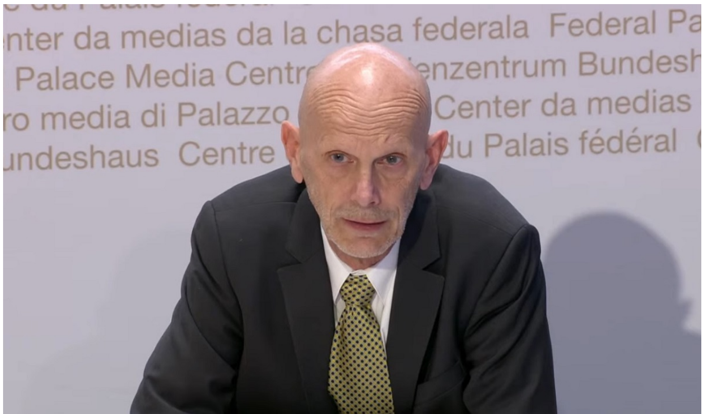
Даниэль Кох. Скриншот трансляции брифинга от 11 апреля

10 апреля власти зафиксировали 734 новых случая заражения коронавирусом, 11-го – 592, а 12-го – 400. В ходе состоявшейся в субботу пресс-конференции представитель OFSP Даниэль Кох заявил, что ситуация стабилизировалась, но подчеркнул, что нельзя недооценивать вирус, так как существует опасность того, что количество новых случаев снова будет увеличиваться. «Нам еще предстоит пройти долгий путь», – отметил Кох и призвал продолжать соблюдать правила самоизоляции, гигиены и социальной дистанции.