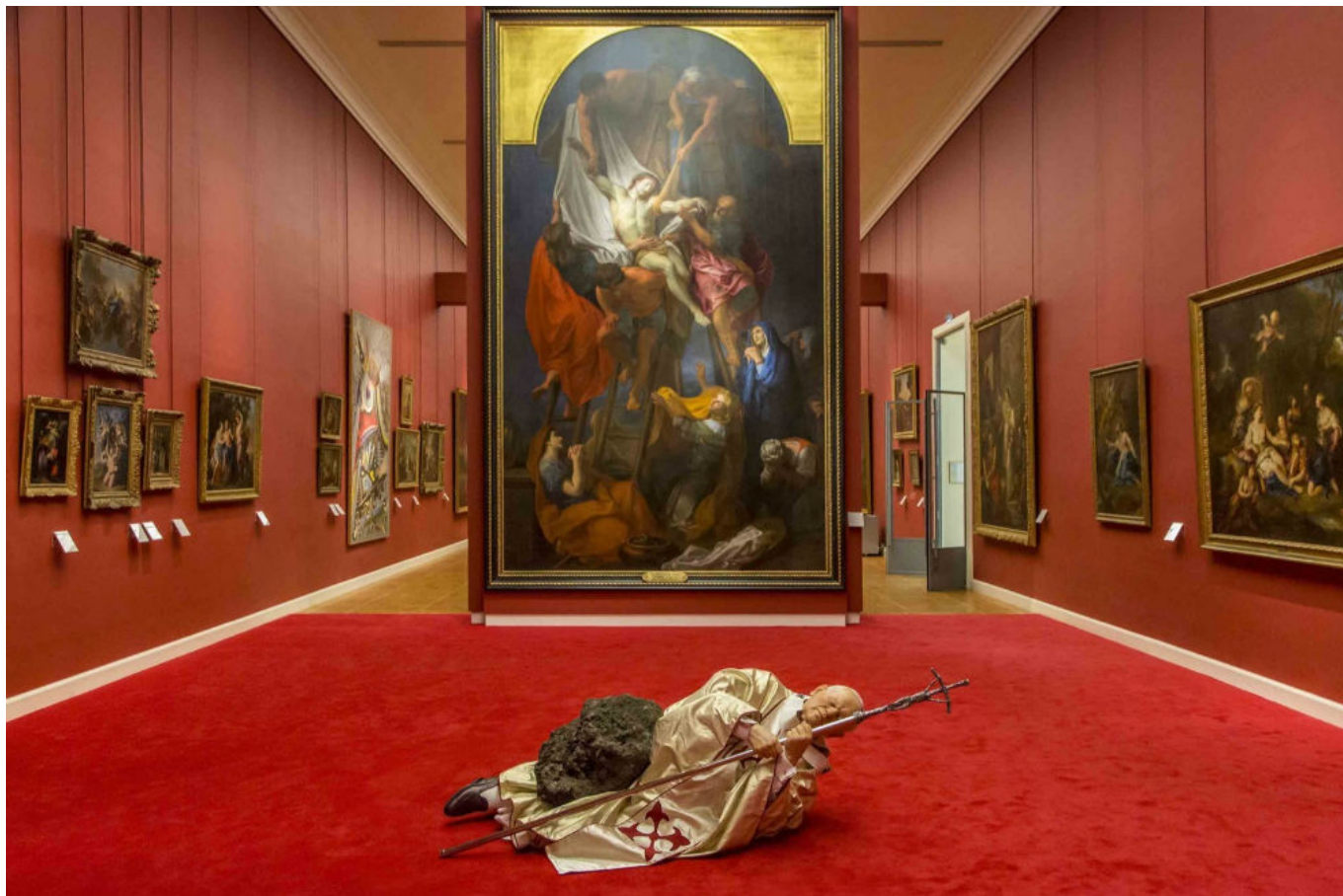
Маурицио Каттелан, «Девятый час» или «Папа, пораженный метеоритом», 1999 г.

Маурицио тоже мастер поразвлечься: украл, хихикая, чужую экспозицию и приволок ее в свой павильон, проводил интервью с мертвыми художниками, поджигал детские коляски, вешал восковые тельца мышей в миланском парке и ставил Гитлера на колени в угол... Этот перечень можно долго продолжать. Его часто обвиняют в пристрастии к провокациям, к пошлым решениям, в китче и дурном вкусе. А он знай себе отвечает: «Для меня хороший вкус – как и вообще вкус – это забота мороженщика». Итальянец, вырос на gelato, ясное дело.