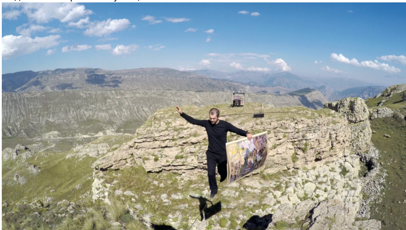
Таус Махачева. Канат, 2015 г.

В распространенном музее коммюнике справедливо отмечается, что Таус Махачева обратила на себя серьезное внимание международной арт-общественности на 57-й Венецианской биеннале, где она представила видео инсталляцию «Канат» (Tightrope, 2015). Работа показывает канатоходца, несущего копии картин из Дагестанского музея изобразительных искусств имени П.С. Гамзатовой в Махачкале через пропасть – метафора, отсылающая к шаткой позиции творца в современном мире и к разным факторам, участвующим в создании художественной ценности. (Стоит заметить, что Патимат Саидовна Гамзатова, с 1964 года возглавлявшая музей в Махачкале, теперь носящий ее имя, была женой знаменитого советского поэта Расула Гамзатова, а Таис – одна из четырех их внучек.)