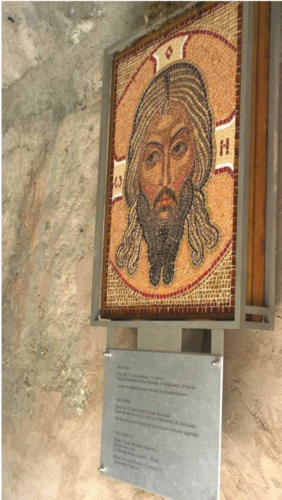
«Мы и без памятника помним»