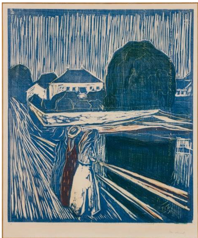
Эдвард Мунк, «Девушки на мосту», 1918 г.

«Герч/Гоген/Мунк» - так называется экспозиция, для которой представитель гиперреализма Франц Герч сам отобрал важные, на его взгляд, работы. Автор, известный, среди прочего, художественной резьбой по дереву, предлагает вниманию посетителей свои ксилографии, разместив рядом с ними гравюры на дереве Поля Гогена и Эдварда Мунка, отмечается в коммюнике LAC.