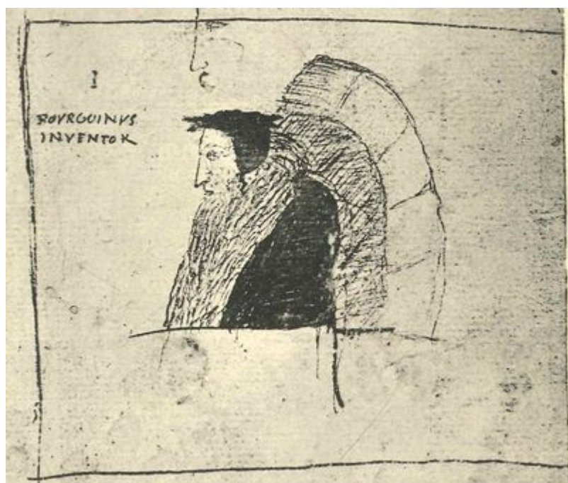
Карикатура на Кальвина, нарисованная одним из его студентов